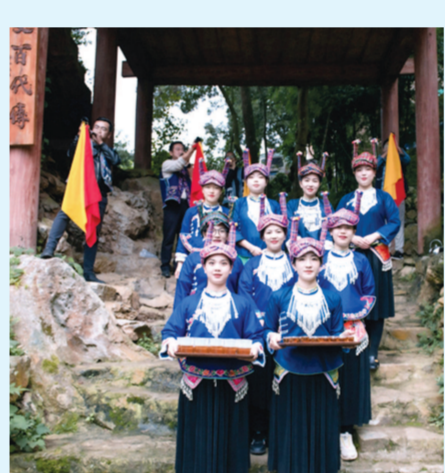
▲壮家儿女在六郎城村古城堡门口迎接远客。