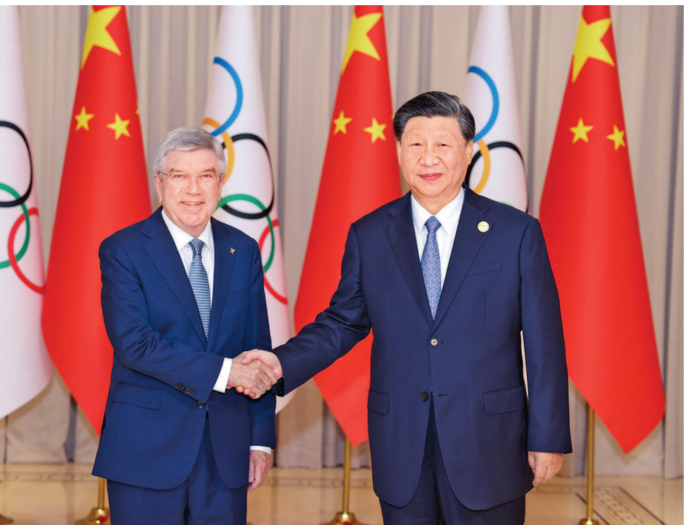
9月22日下午，国家主席习近平在杭州西湖国宾馆会见来华出席第19届亚洲运动会开幕式的国际奥林匹克委员会主席巴赫。