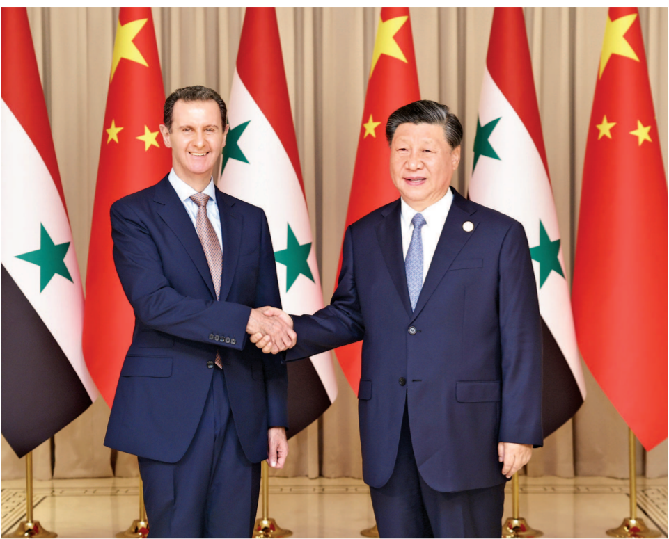
9月22日下午，国家主席习近平在杭州西湖国宾馆会见来华出席第19届亚洲运动会开幕式的科威特王储米沙勒。