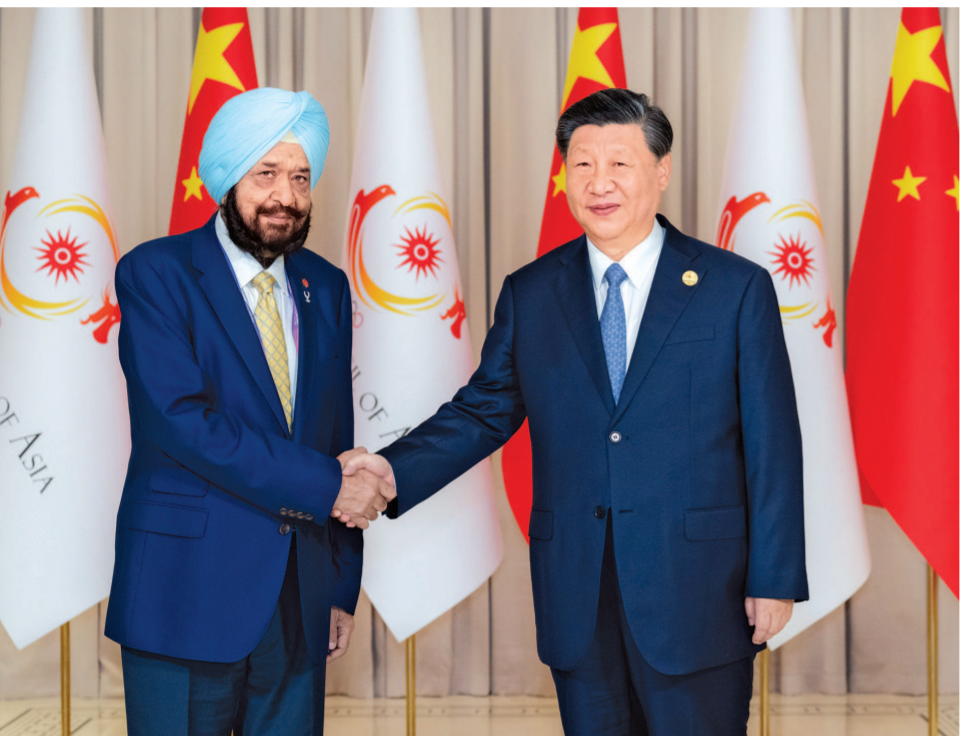
9月22日下午，国家主席习近平在杭州西湖国宾馆会见来华出席第19届亚洲运动会开幕式的亚洲奥林匹克理事会代理主席辛格。