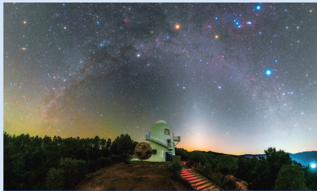
▲2021年11月份,拼多多为湖南省浏阳市小河乡捐款建设乡村准专业级天文台

9月5日,民政部发布《关于表彰第十二届“中华慈善奖”获得者的决定》。144个爱心个人、爱心团队、捐赠企业、慈善项目和慈善信托被授予第十二届“中华慈善奖”。上海寻梦信息技术有限公司(以下简称拼多多)作为捐赠企业入选表彰名单。