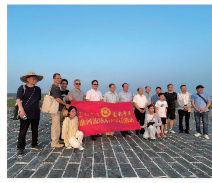
部分寻访人员在西华门上合影

凤阳明中都：是淮河边唯一一座都城，明太祖朱元璋登基后，在家乡凤阳悉心营建的第一座都城，被誉为“明初三都之首”，是营建南京故宫和北京故宫的蓝本。它作为营建于14世纪中叶的都城遗址，以其规模宏大、保存完好的城址遗存及其山水环境、丰富的历史信息和文化内涵，是中国及东亚礼制城市设计思想发展到成熟阶段的稽古创新之作。明中都见证了封建社会后期的国家祭祀、军卫、礼仪等制度，是明朝的建立与中前段历史的重要物证。