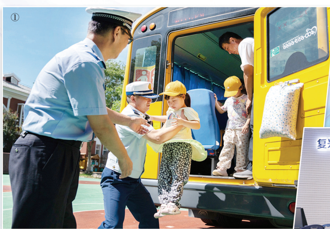
①在金山区吕巷幼儿园,消防员和交警对校车进行安全“体检”。 ②黄浦区卢湾一中心小学在开学前组织新生培训。 ③复兴高级中学改造升级后的创新智能实验室。 制图:冯晓瑜

在上海师范大学附属奉贤实验中学,六年级学生们在开学前,也纷纷走进学校小剧场、图书馆、专用教室等场所,与即将开启学习生活的校园有了一次亲密接触。不仅如此,在各个教室,一场场“破冰”行动,让大家在介绍自己、展示才艺的同时,也拉近了师生之间的距离。