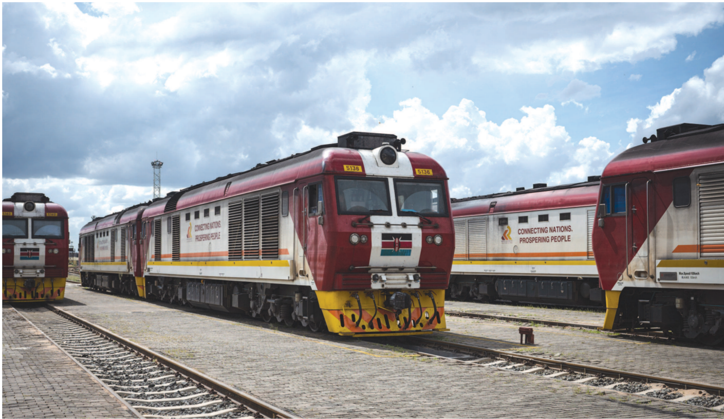
▲作为中国和肯尼亚共建“一带一路”旗舰项目的蒙内（蒙巴萨—内罗毕）铁路

和合共生、天下大同是中华民族千百年来的美好追求。这决定了“中国实现现代化是世界和平力量的增长，是国际正义力量的壮大，无论发展到什么程度，中国永远不称霸、永远不搞扩张”。走和平发展道路的中国式现代化如何助推国际关系民主化？如何推动全球治理变革朝着更加公正合理的方向发展？如何为世界注入更多确定性、稳定性、正能量？本报约请三位专家从“金砖+”解读中国式现代化的世界意义。