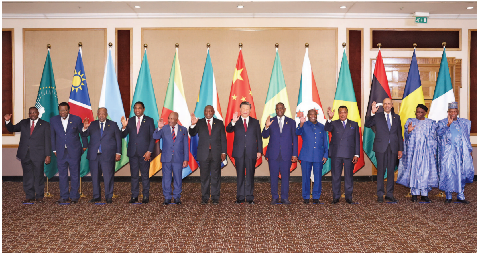
当地时间8月24日晚,国家主席习近平和南非总统拉马福萨在约翰内斯堡共同主持中非领导人对话会。这是会前集体合影。