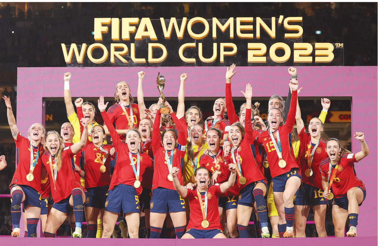
西班牙女足庆祝夺冠，西班牙成为继德国后第二个包揽男女足世界杯冠军的国家。

与西班牙共演这场“欧洲德比”的英格兰队，同样得益于青训和联赛的支撑，在过去几年间取得飞速进步。女足英超联赛的成功，很大程度上推动了整个欧洲女子职业联赛乃至世界女足的快速发展。加上获得季军的北欧劲旅瑞典队，欧洲球队包揽了本届世界杯前三名。随着欧洲女子职业联赛逐渐成熟，世界女子足坛的格局已进入新时代。