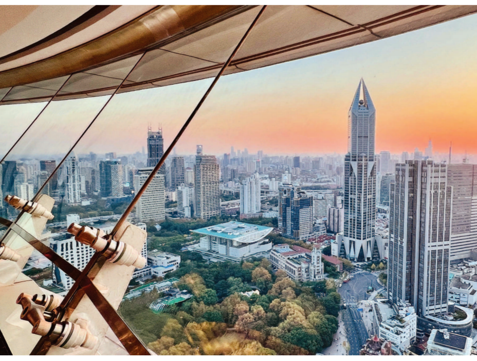
从新世界丽笙大酒店旋转餐厅俯瞰。