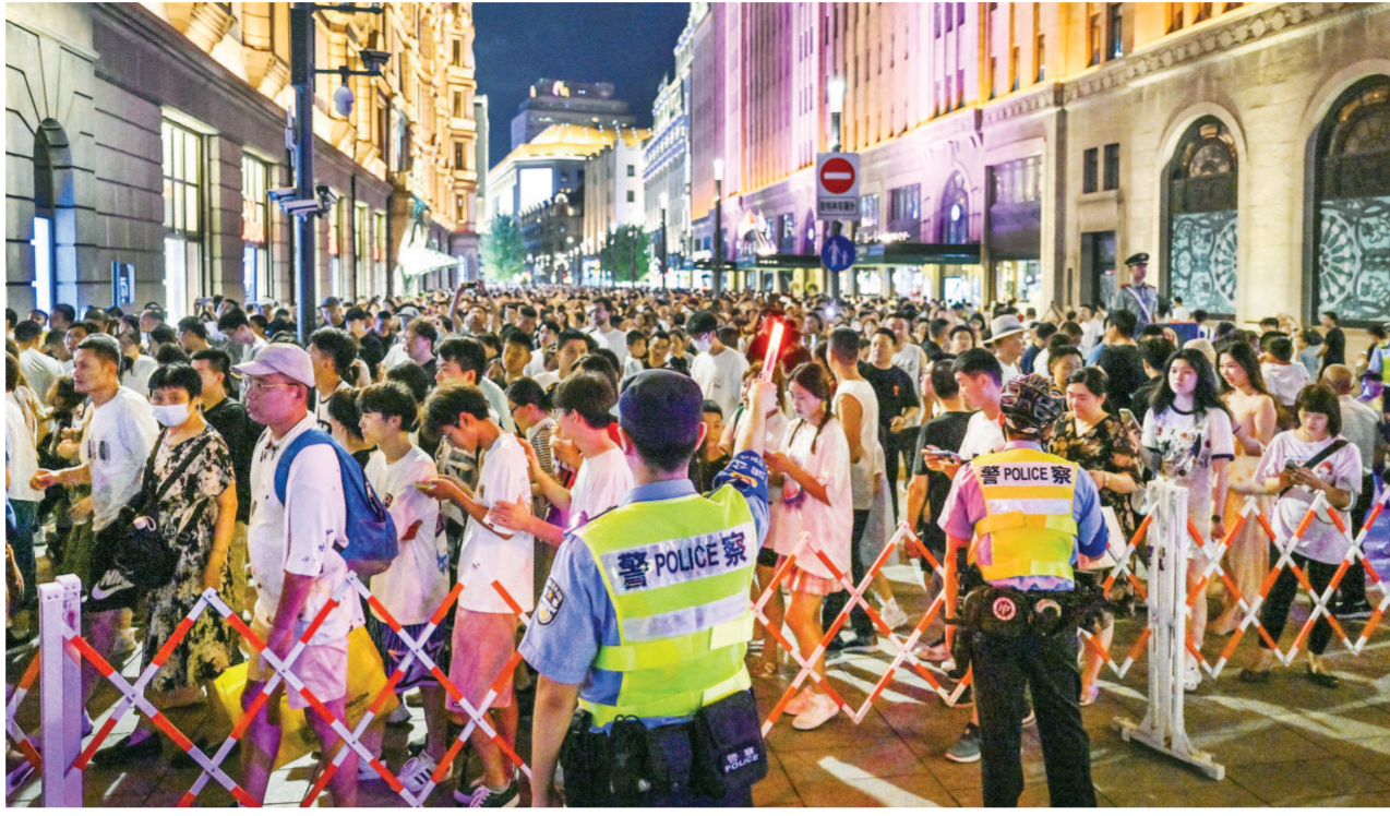
黄浦公安分局三个属地派出所和南京东路骑警一体化管理,让市民游客在外滩出行安心有序。

放眼长宁区,“十四五”期间,将继续保持每年上新2至3座口袋公园的速度。且充分考虑公众需求,因地制宜施行“定制”,既打造出“小而美”的视觉规律,又集成可玩可休憩的功能要素,让“小口袋”装入民生福祉,回应人心所盼。