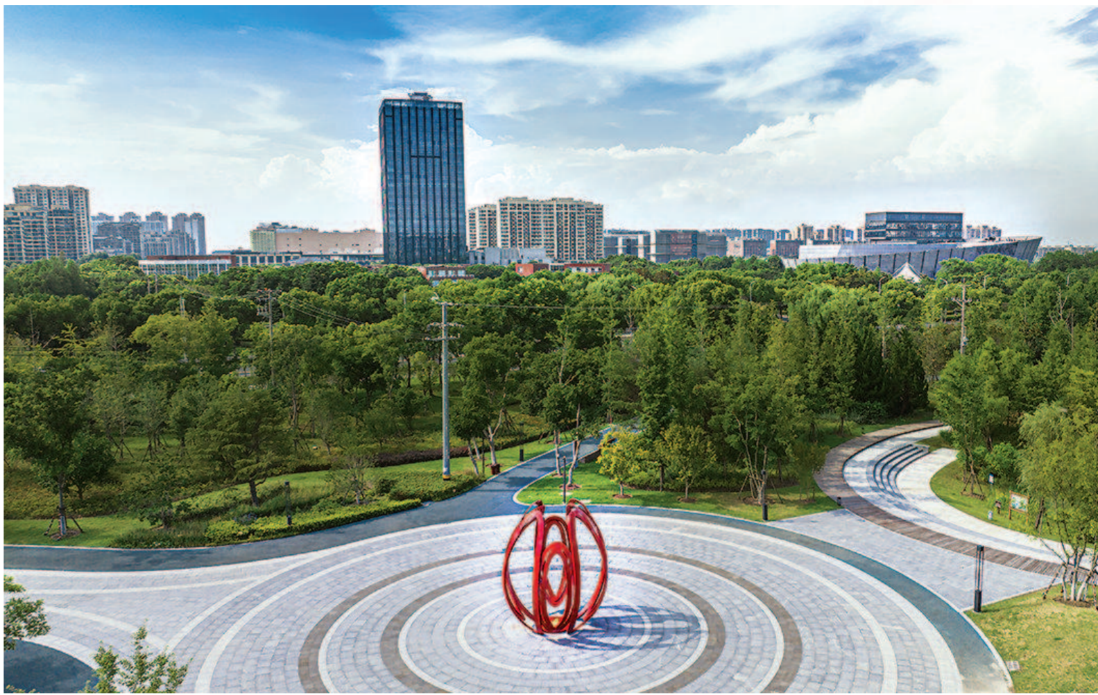
金山双拥公园标志性雕塑“同心圆”。