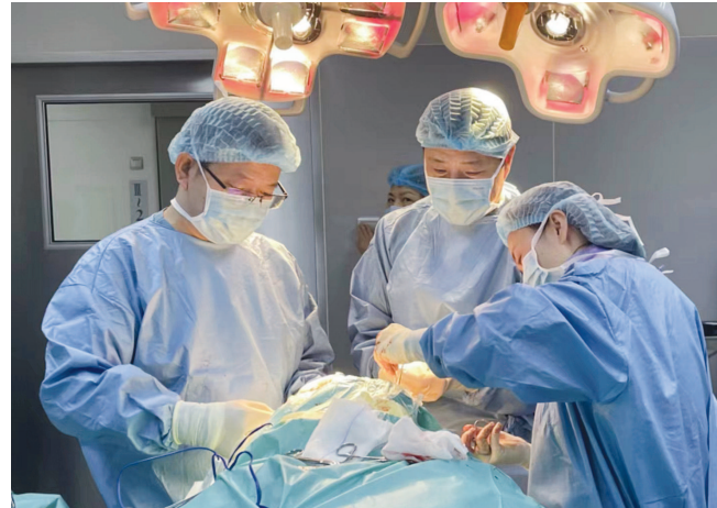
瑞金医院功能神经外科中心医疗团队为帕金森病患者植入智能感知脑起搏器。

研究显示，在接受脑起搏器治疗的患者中，每十个人中就有七人将在未来10年内进行磁共振检查。这款智能感知脑起搏器Percept PC同时兼容3.0T和1.5T全身核磁共振扫描，保证了患者可在未来接受核磁共振检查。