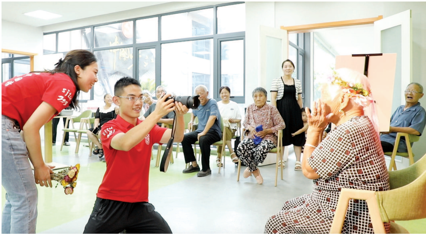
对这9人实践团而言，深入乡村的过程，也是认识乡村、读懂中国的一次良机。

中水寨村的手机课不仅在村内受好评，消息更传到了隔壁村。而后，实践团走进村——东水寨村，手把手教乡亲们使用智能手机。在大学生的帮助下，有老人靠自己给远在城里的孙女拨通了第一个视频电话，看到了心心念念的孙辈；有老人现学