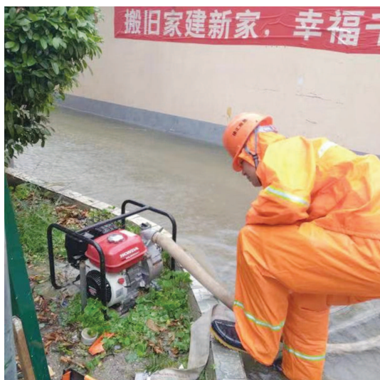
昨天，徐房物业小区应急抢险人员对积水进行排水处置。