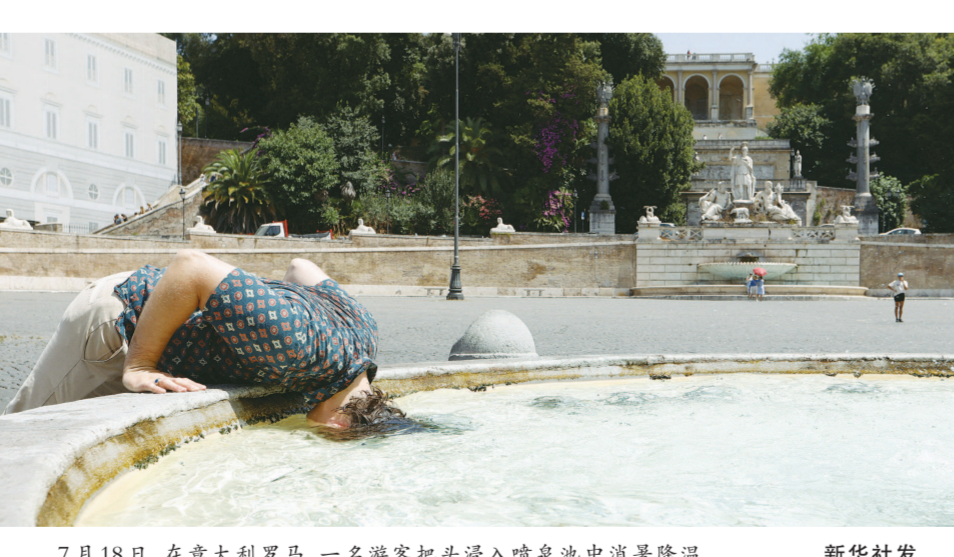
7月18日,在意大利罗马,一名游客把头浸入喷泉池中消暑降温。

美国“准确天气预报”公司气象学家预测,17日至21日,得州最大城市休斯敦每日最高气温将达到至少37.8摄氏度。相比之下,往年这一时期的正常最高气温约为34.4摄氏度。