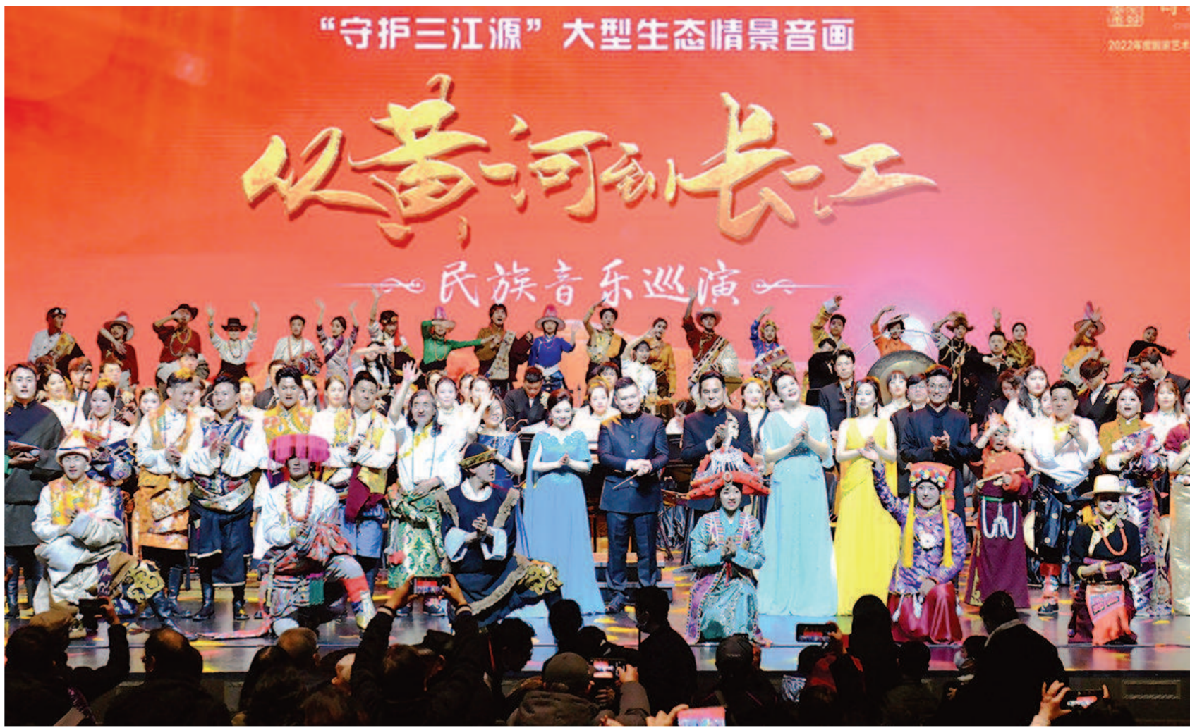
3月底，“守护三江源”生态情景音画在上海奏响并拉开全国巡演序幕，《从黄河到长江》讲述浓浓沪果情。