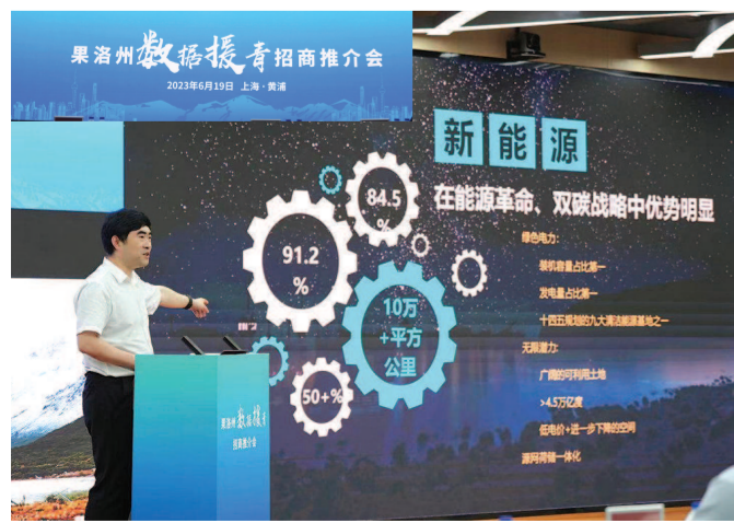
果洛州“数据援青”招商推介会在沪举行。

而7月14日首发的上海援青旅游包机，则为沪果两地的文旅梦想再添一助力。在春秋集团的助力下，越来越多上海游客有机会进入三江源腹地，在蓝天白云下，在群山怀抱中，去探索阿尼玛卿雪山、冬格措纳湖这些如画的藏乡秘境，去探寻格萨尔文化不朽的史诗传奇。