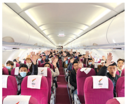
果洛119名青年乘包机来沪就业。

上海与青海，在战略方位、资源禀赋、发展优势上互补性强，合作前景十分广阔。“我住长江源，君住长江口，绿色算力盼君来，共立新潮头。”6月，在上海市援青干部联络组的充分对接下，果洛州“数据援青”招商推介会在上海举行。未来，上海将助力青海围绕国家清洁能源产业高地建设，充分利用新能源、紧抓新机遇，打造盐湖、新能源、新材料、有色冶金、大数据五大产业，力争到2025年建成东数西算算力枢纽。