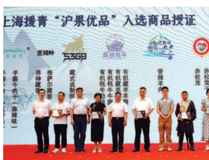
“沪果优品”入选商品投证。