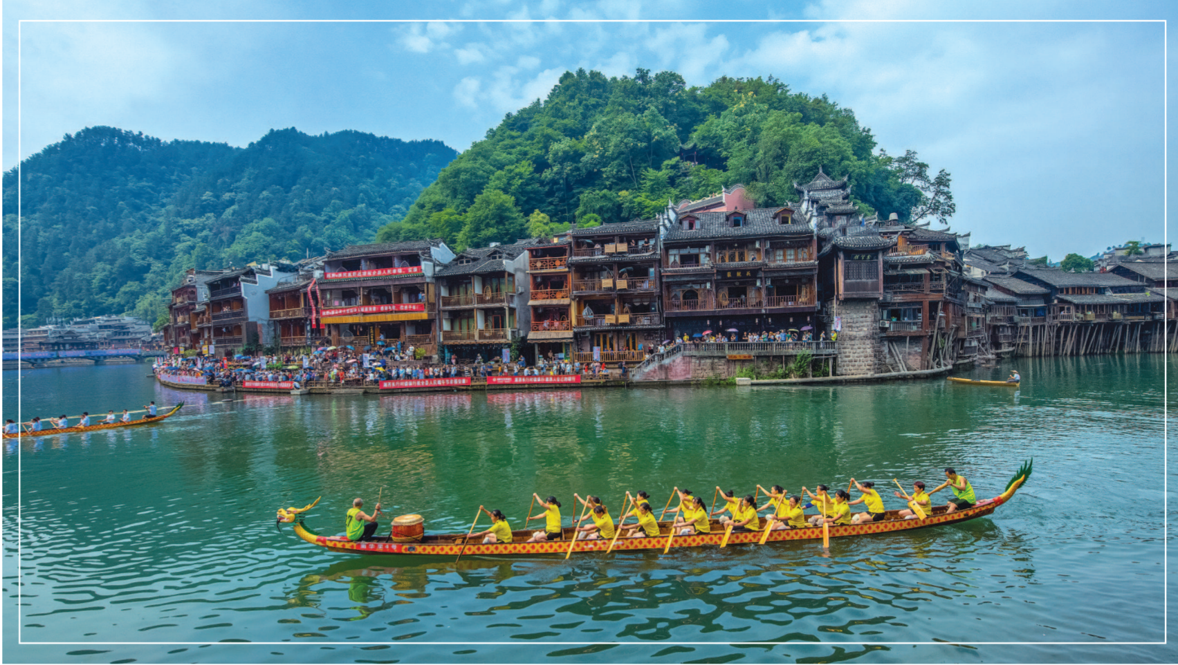
湖南，端午节，赛龙舟。

上海大学党委副书记、全国非遗名词委主任段勇强调，非遗名词遴选审定对构建非遗体系的“中国范式”，促进非遗学科建设的科学化、系统化、国际化及规范化具有重大意义。