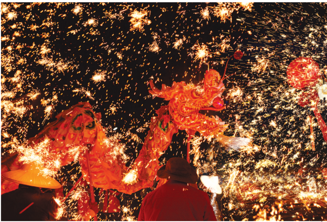
▲作为首批国家级非遗，重庆铜梁龙舞被誉为“中华第一龙”。