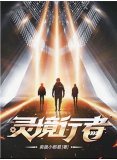
《我们生活在南京》《夜的命名术》《深海余烬》《灵境行者》等科幻网文涌现。