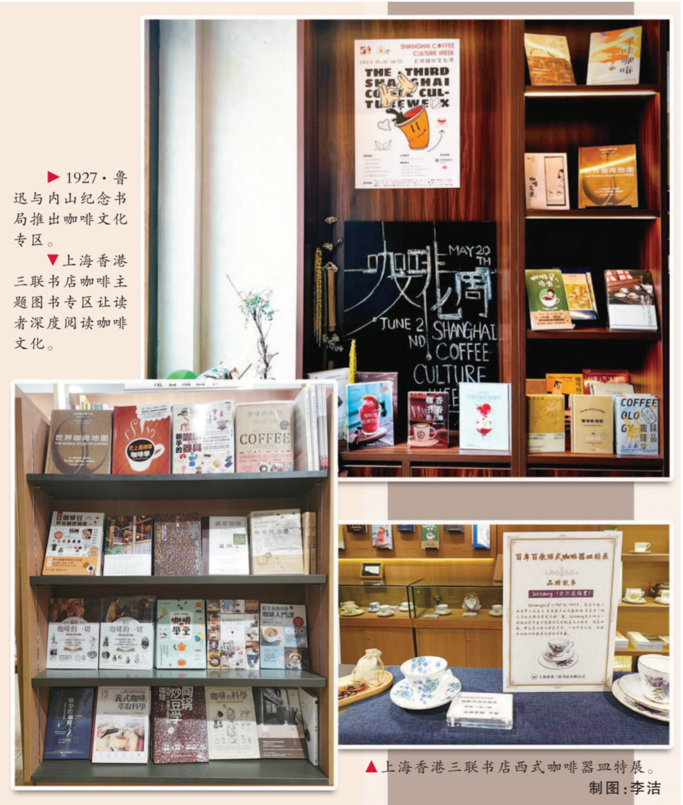
1927·鲁迅与内山纪念书局推出咖啡文化专区。上海香港三联书店咖啡主题图书专区让读者深度阅读咖啡文化。

“百年百款西式咖啡器皿特展”呈现的百款咖啡器皿中,以花式骨瓷为主,兼有描金、手绘。“咖啡从满足口腹之欲的饮品,逐渐演变为一种精致生活美学方式。”长三