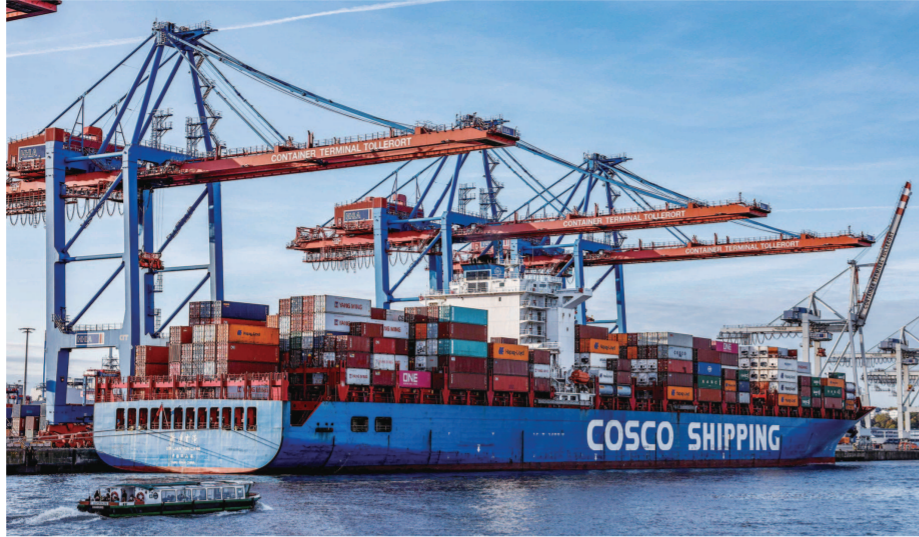
去年10月26日,中国远洋集装箱船“新联运港”号在汉堡港“福地”码头卸货。

当地时间5月10日,德国政府在经历了反复“拉锯”后最终确认,中国中远集团对德国汉堡“福地”码头24.9%的股权收购案可以继续,双方于去年10月敲定的协议内容不变。