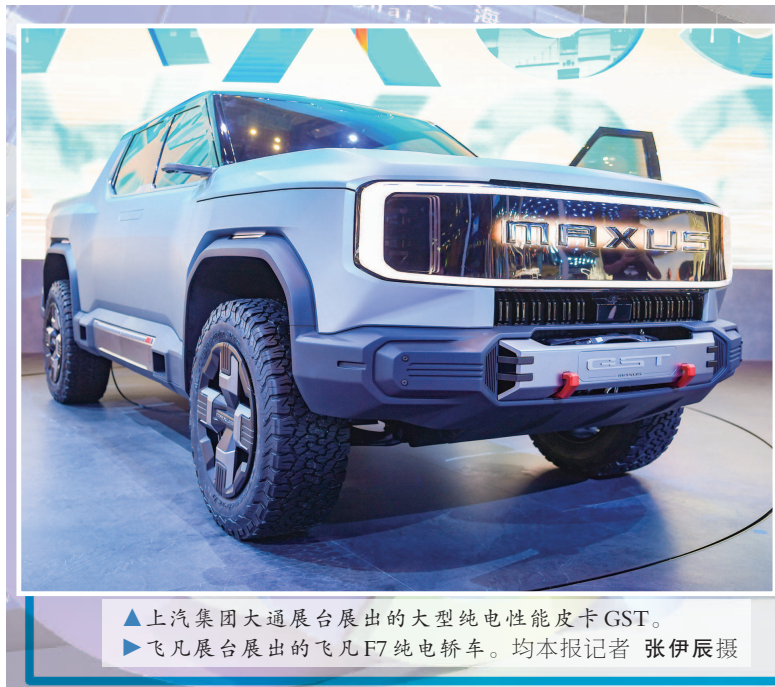
▲上汽集团大通展出的大型纯电性能皮卡GST。 ▲飞凡展出的飞凡F7纯电轿车。

“上海汽车业已进入‘引进来’与‘走出去’并重的发展阶段。”市商务委副主任张国华告诉记者,目前上海汽车产业出海呈现出一批新趋势:出口市场结构趋向高端化;产业链布局趋向全球化;汽车出海转向低碳化、绿色化,新能源出口占比提升。以撕掉“低端化”标签为例,中国及上