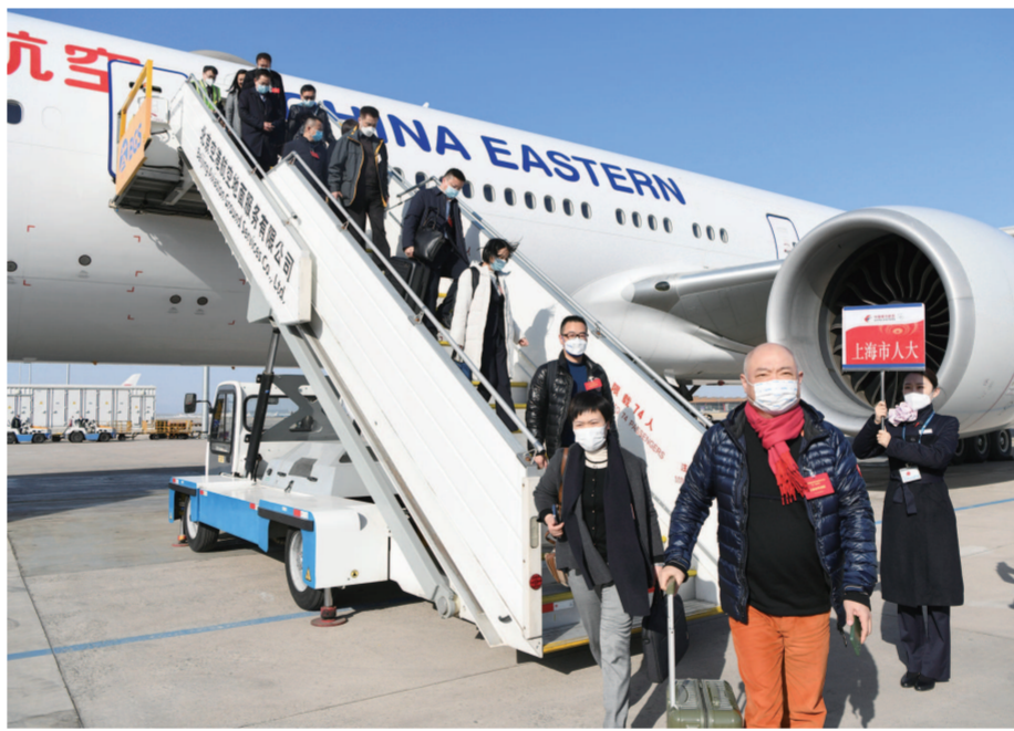
在沪全国人大代表抵京。