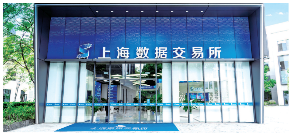
过去半年,上海数交所联手回力、三枪、佛手等策划发行数万份数字资产。