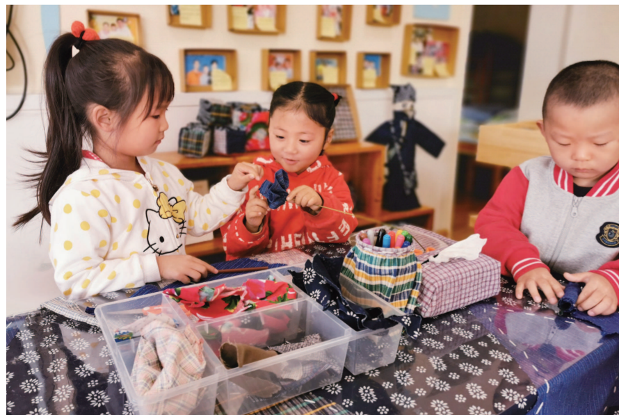
金山区干巷幼儿园获评市一级幼儿园。