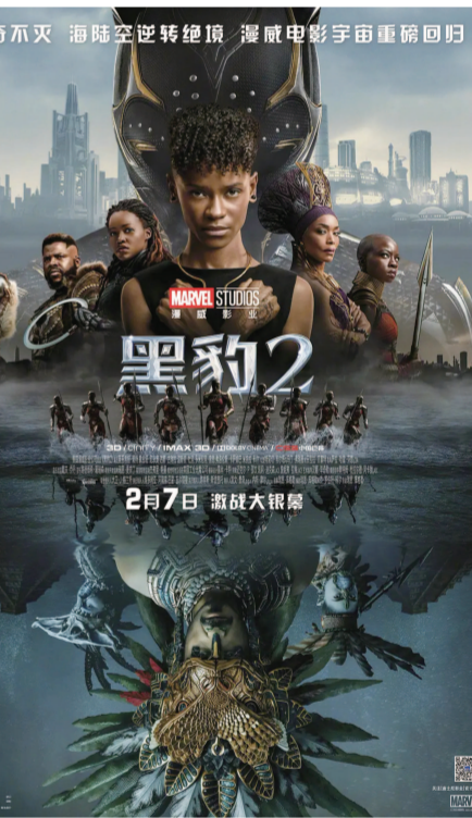
《黑豹2》与《蚁人与黄蜂女:量子狂潮》分别定档2月7日和2月17日。图为《黑豹2》海报。

目前,浦东新区大企业开放创新中心计划已吸引各行业领军企业踊跃加入,去年新增31家,总量达65家,累计赋能中小企业超2200家,其中1000余家实现技术突破,引进新注册企业超过300家,举办各类赋能活动超800场,参与企业1.4万家。今年GOI计划继续加速推进,牵引打造全国最领先最活跃的创新生态。