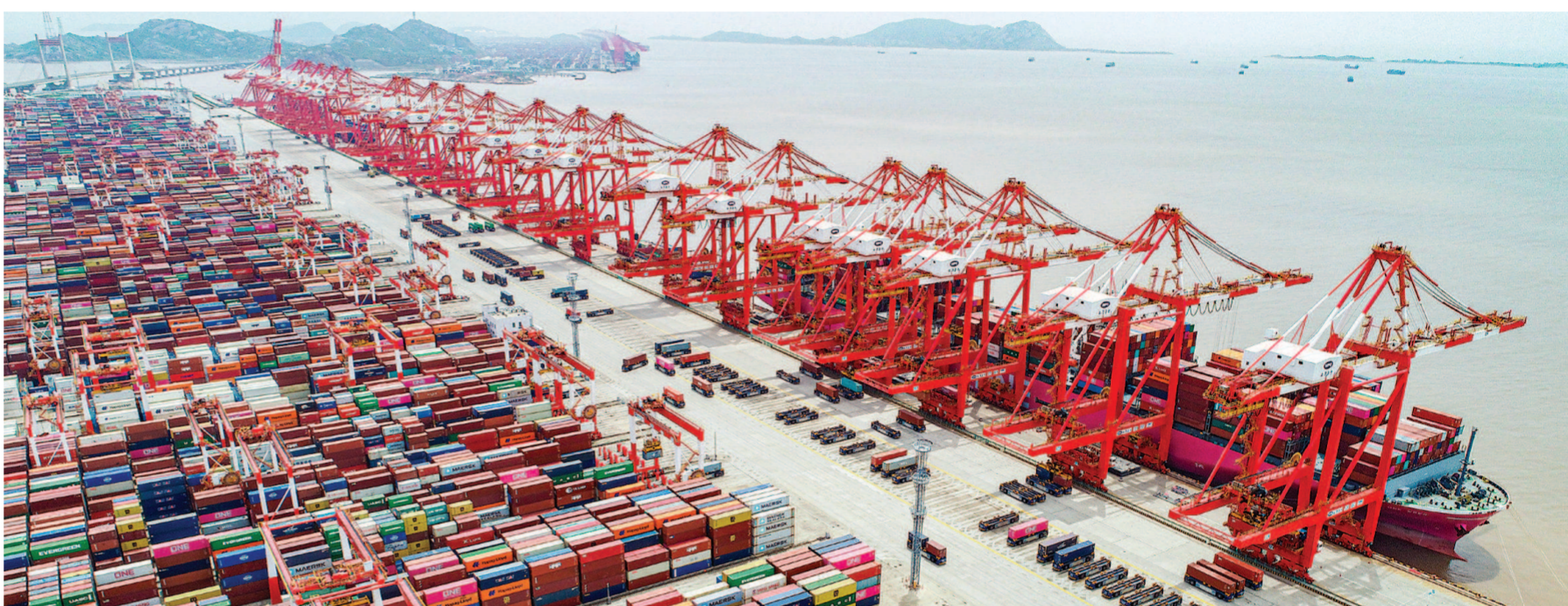
繁忙的上海洋山港四期自动化码头。