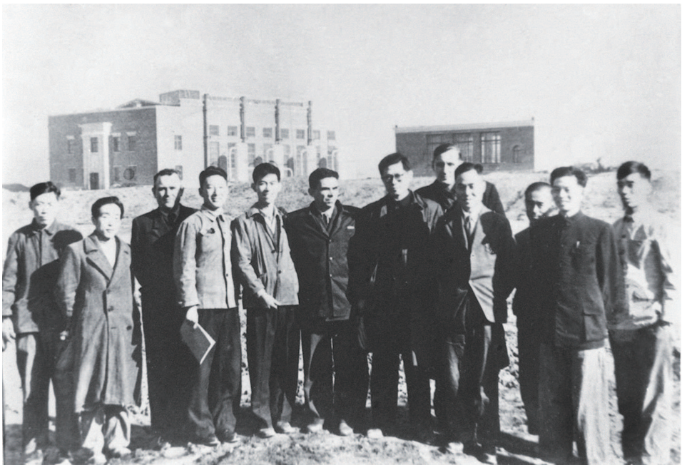
▲1956年，江泽民同志(左七)在长春第一汽车制造厂同援建一汽的苏联专家等合影。