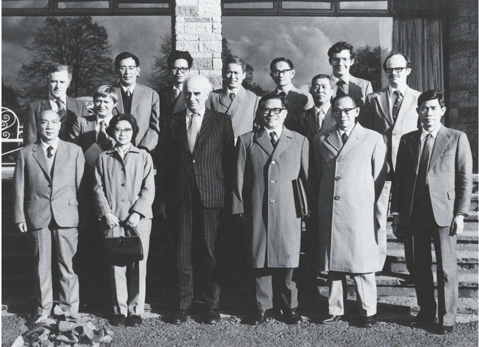
▲1980年10月底，江泽民同志(前排右三)在爱尔兰香农开发区考察时同开发区负责人等合影。