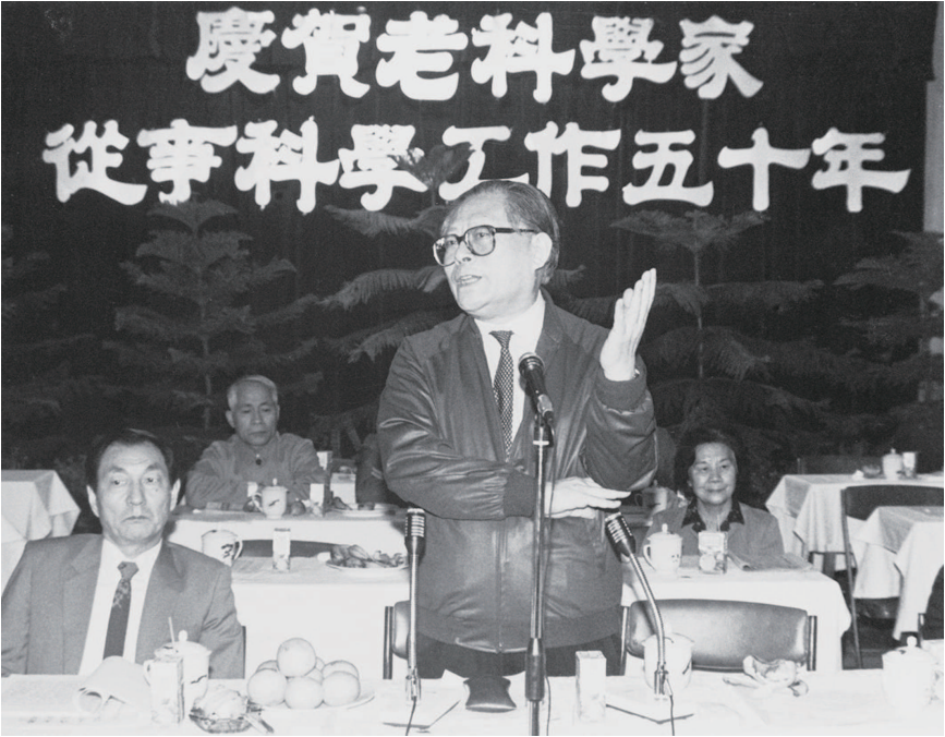
▲1988年10月，江泽民同志在上海庆贺老科学家从事科学工作五十年座谈会上讲话。