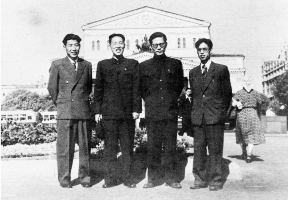
▲1955年至1956年，江泽民同志(右二)曾在莫斯科大林汽车制造厂实习。这是江泽民等在莫斯科合影。