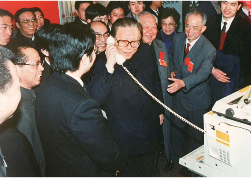
▲1984年5月，江泽民同志在北京展览馆举行的全国电子新产品展览会上，试用国际长途电话向远方的工作人员问候。