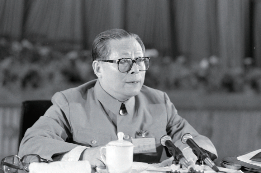
▲1989年6月23日至24日，中国共产党第十三届中央委员会第四次全体会议在北京召开。这是江泽民同志在会上讲话。