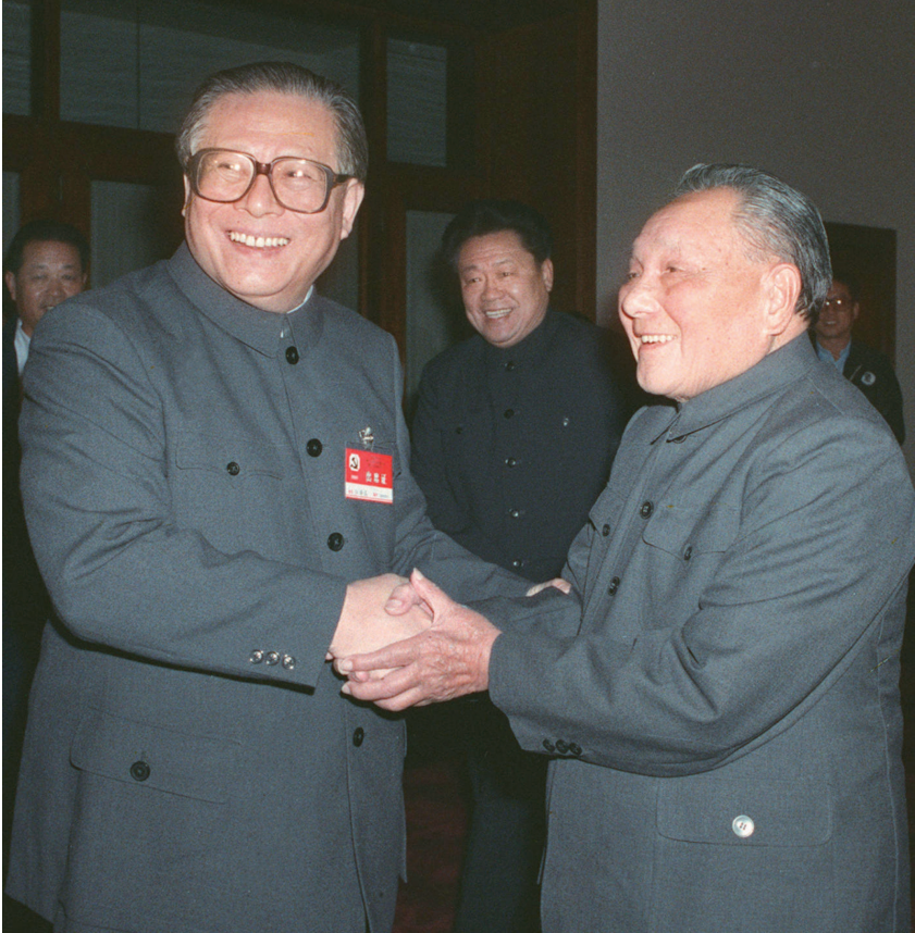
►1989年11月6日至9日，中国共产党第十三届中央委员会第五次全体会议在北京召开。这是邓小平同志和江泽民同志亲切握手。