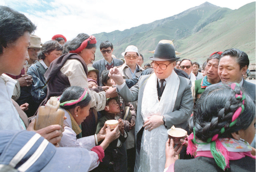
▲1990年7月25日，江泽民同志与藏族群众共庆望果节。