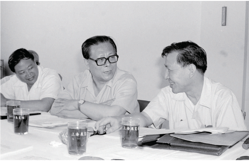
▲1985年，江泽民同志在上海市八届人大四次会议上。