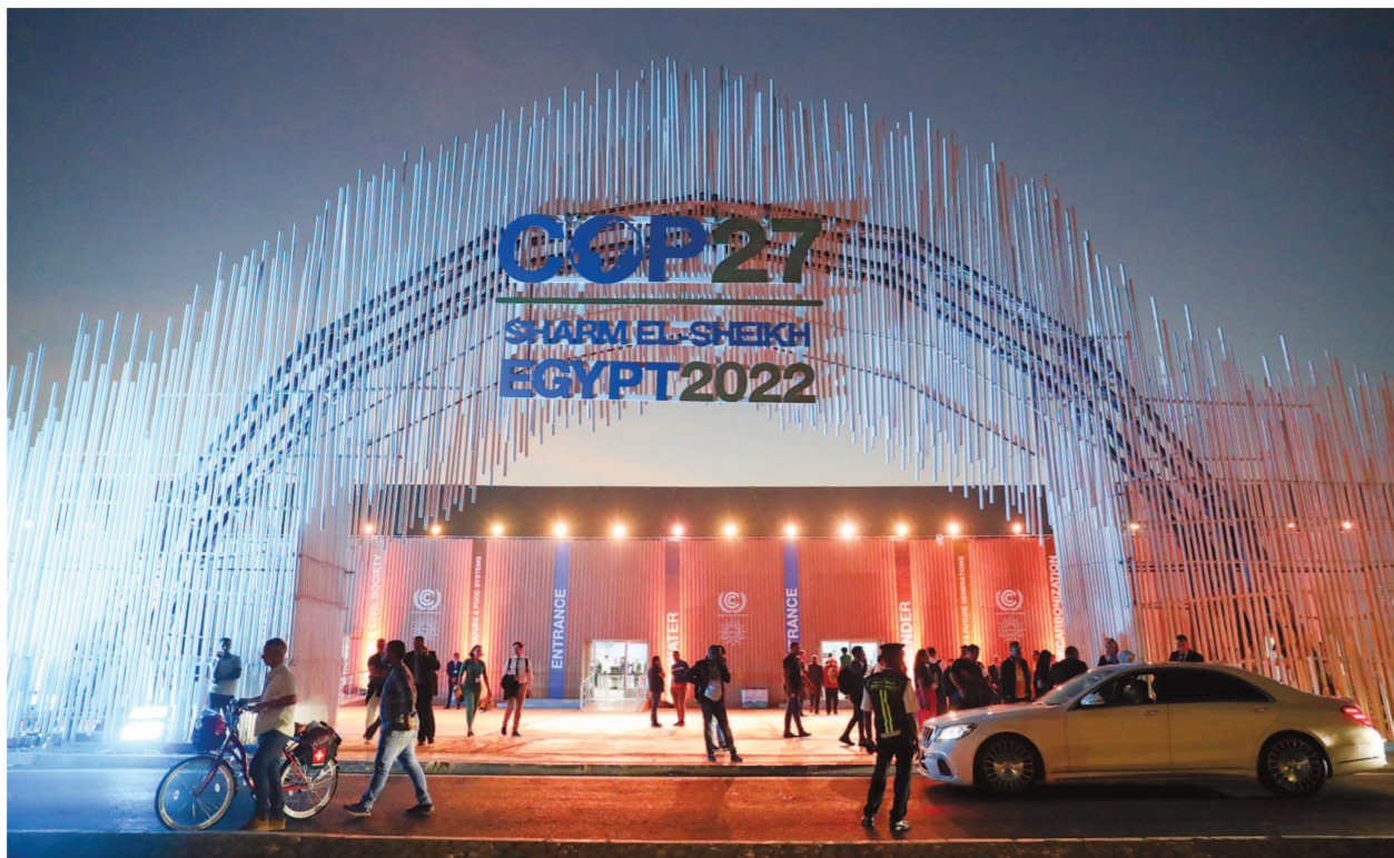
11月5日，埃及沙姆沙伊赫，联合国气候变化大会媒体注册入口。

据统计，由于燃料价格不断上涨，2021年全球对化石燃料的补贴几乎比2020年翻了一番。俄乌冲突等“黑天鹅事件”更是给全球脱碳进程带来逆转风险。例如，为减少天然气发电，今年7月，德国提出重启燃煤和燃油发电厂，以确保能源供应安全。法国能源部的一份声明中也提出2022年冬天或将重启位于该国东北部的煤炭发电厂。据悉，为支持化石燃料行业发展，2021年，二十国集团开支近7000亿美元，其中对油气、煤炭和化石燃料发电的援助达到了2014年以来的最高水平。这些举措无疑延迟了削减碳排放的进程。据国际能源署预