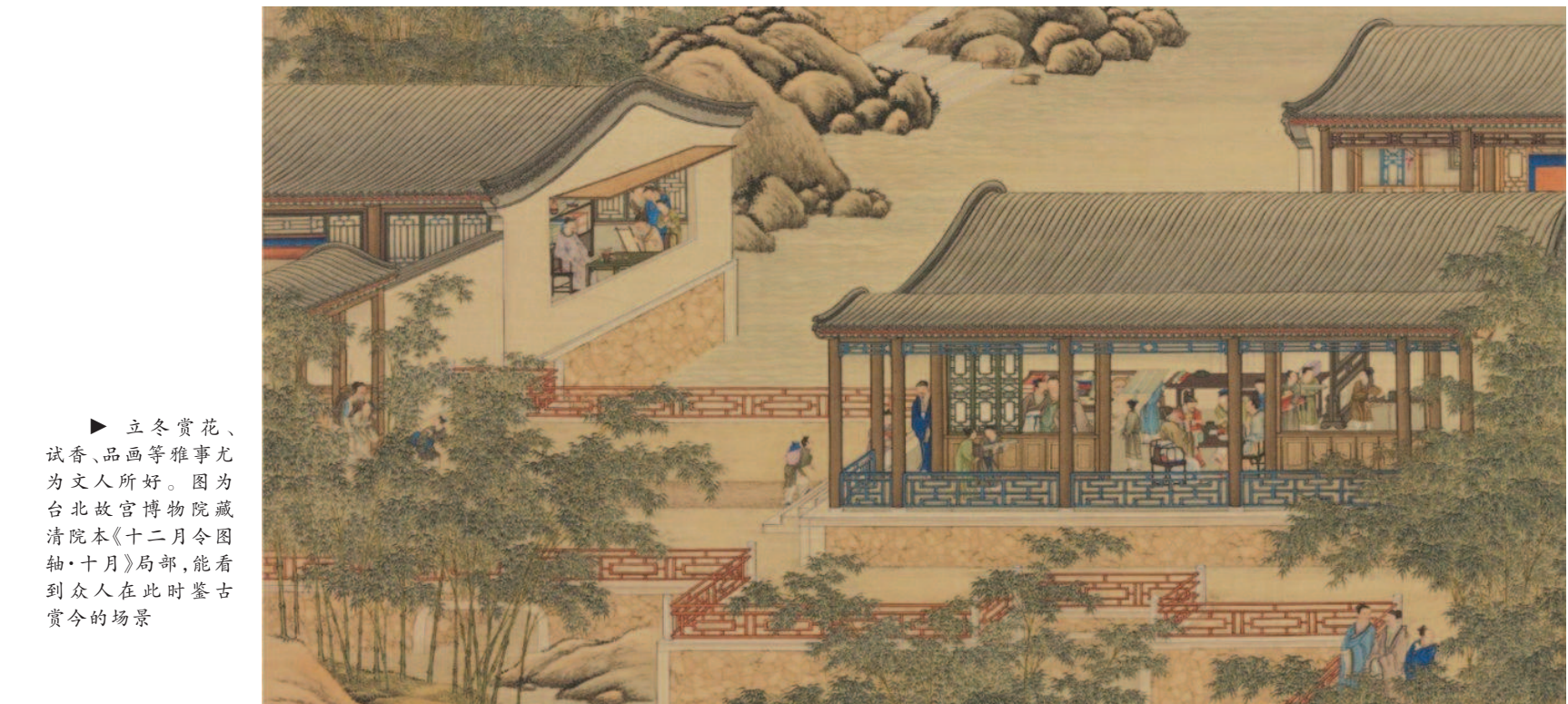
► 立冬赏花、试香、品画等雅事尤为文人所好。图为台北故宫博物院藏清院本《十二月令图轴·十月》局部，能看到众人在此时赏古赏今的场景

（作者为上海工艺美术职业学院非遗理论与应用创新基地研究员、华东师范大学非物质文化遗产传承与应用中心特聘研究员）