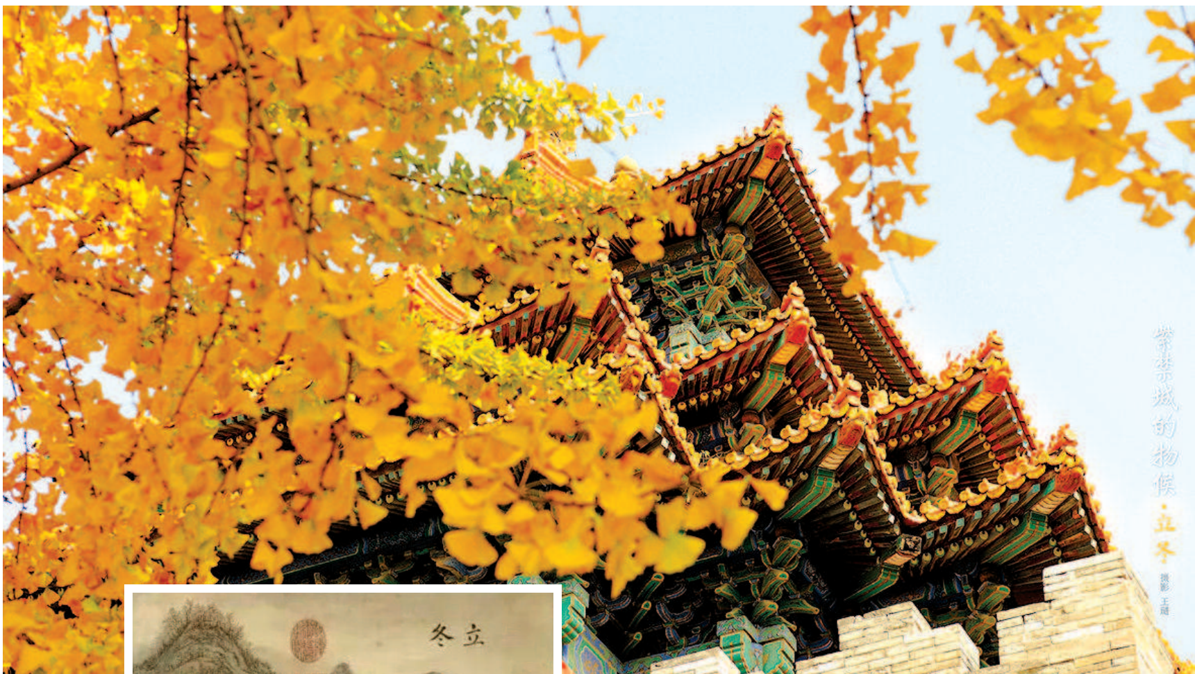
▲ 故宫二十四节气物候之立冬

进入冬月十月，也是祭祖的重要月份。《礼记·月令》中有“孟冬之月天子以猎物祭祀先祖”的记载。《礼记·玉制》载：“天子诸侯宗庙之祭，春曰郊，夏曰禘，秋曰尝，冬曰烝。”汉代董仲舒在《春秋繁