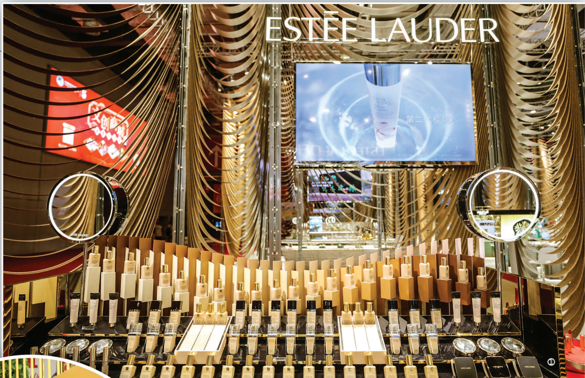
①雅诗兰黛集团携旗下在华销售的十余个品牌和一些尚未进入中国市场的护发、护肤、彩妆等产品亮相消费品展区。

迎来五洲客，共计天下利。随着中国推动各国各方共享中国大市场机遇，共享制度型开放机遇，共享深化国际合作机遇，进博会必将迎来更多“回头客”，更多进博会溢出效应也将持续显现。