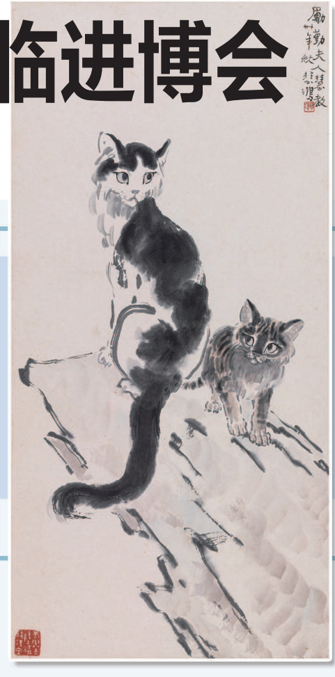
▲吳冠中《江南園林》。 ▲夏加爾《巴黎的天空》。 ▲徐悲鴻《貓趣》。（市文旅局供图） 制圖：李潔