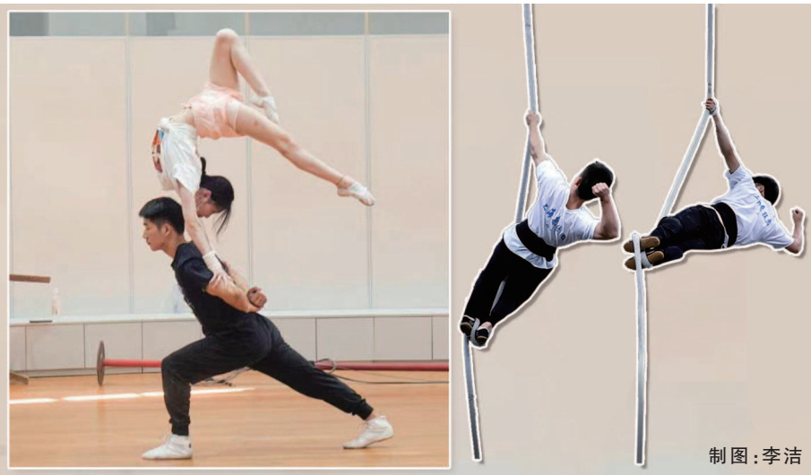
上海杂技团为创排新剧《天山雪》研发的杂技新节目。(均上海杂技团供图)

■铺展跨越70多年援疆、文化润疆的历史画卷 ■从“为祖国夺金牌”到“为上海排好一出剧”