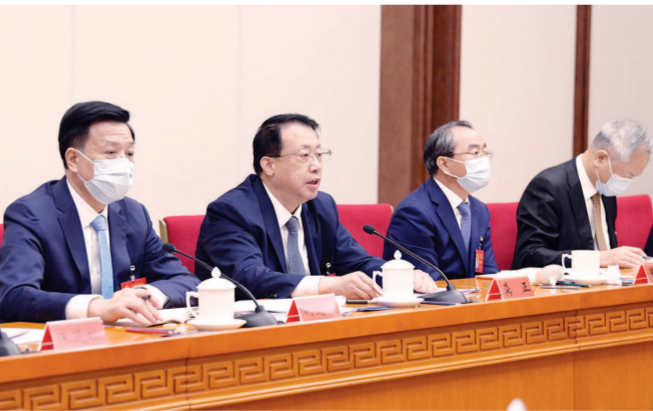
龚正代表参加上海市代表团分组讨论。

举、民主协商、民主决策、民主管理、民主监督工作各方面,全力打造全过程人民民主最佳实践地。 董云虎代表在讨论时说,习近平总书记的报告举旗定向、站高望远,思想精深、振奋人心,集中了全党智慧,顺应了党心民心,体现了国家意志,是新时代新征程我们党党强党、兴国强国的政治宣言和行动指南。新时代十年的伟大变革和历史成就彪炳史册、启迪未来,我们要从中更加深刻地领悟“两个确立”的决定性意义,进一步增强做到“两个维护”的政治自觉和行动自觉。