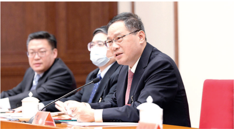
李强代表参加上海市代表团分组讨论。

蒋卓庆代表在讨论时说,习近平总书记所作的报告思想深邃、统揽全局,开辟了马克思主义中国化时代化的新境界,令人倍受鼓舞、倍感振奋、倍增信心。我们要深刻领悟、深入把握习近平新时代中国特色社会主义思想的世界观和方法论,坚持好、运用好贯穿其中的立场观点方法,要深刻领悟、深入把握中国式现代化,明确新时代新征程中国共产党的使命任务。全面建设社会主义现代化国家、全面推进中华民族伟大复兴,关键在党。推进中国式现代化,最根本的是要把我们自己的事情做好。加强中国特色社会主义现代化建设,要坚持全过程人民民主重大理念。报告进一步提出发展全过程人民民主,保障人民当家作主,作为全过程人民民主重大理念的首提地,我们要进一步将这一重大理念贯穿到民主选