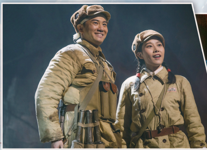
话剧《英雄儿女》侧重展示角色内心情感,以饱满人物形象唤醒人们内心深处英雄记忆。(上海话剧艺术中心供图) 制图:冯晓瑜