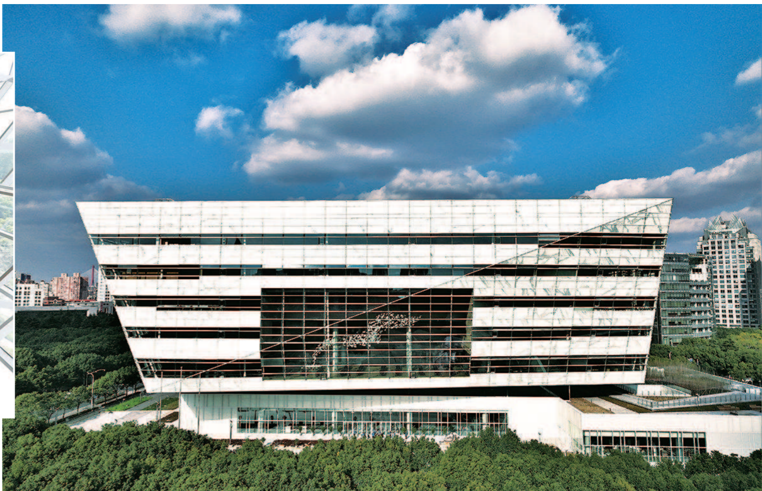
▶上海图书馆东馆外景