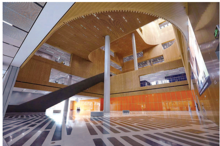
▲上海图书馆东馆一楼的中庭,采用的是上下贯通的设计,引用的是一个太湖石的概念,它的特点就是“瘦、漏、透”,读者只要站在中庭,抬起头就可以看到各个楼层、各个方向不同功能的阅览空间。