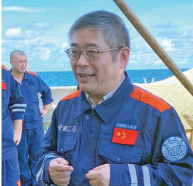
翦知溥2020年主持中国载人深潜器“深海勇士号”的南海深潜航次

翦知溥已指导博士研究生、硕士研究生50多名,培养博士后10余名。他特别注重学生的基础理论培养、实践能力提升、国际合作参与,形成了教学、实践、科研