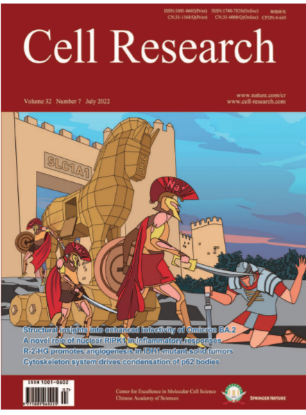
《细胞研究》(左)和《分子植物》(右)杂志封面。

从国际刊物来看,英国《柳叶刀》杂志影响因子达到202.731,涨幅高达155.58%;《细胞》《科学》《自然》(CNS)的影响因子,也都呈现10分以上的“普涨”。从