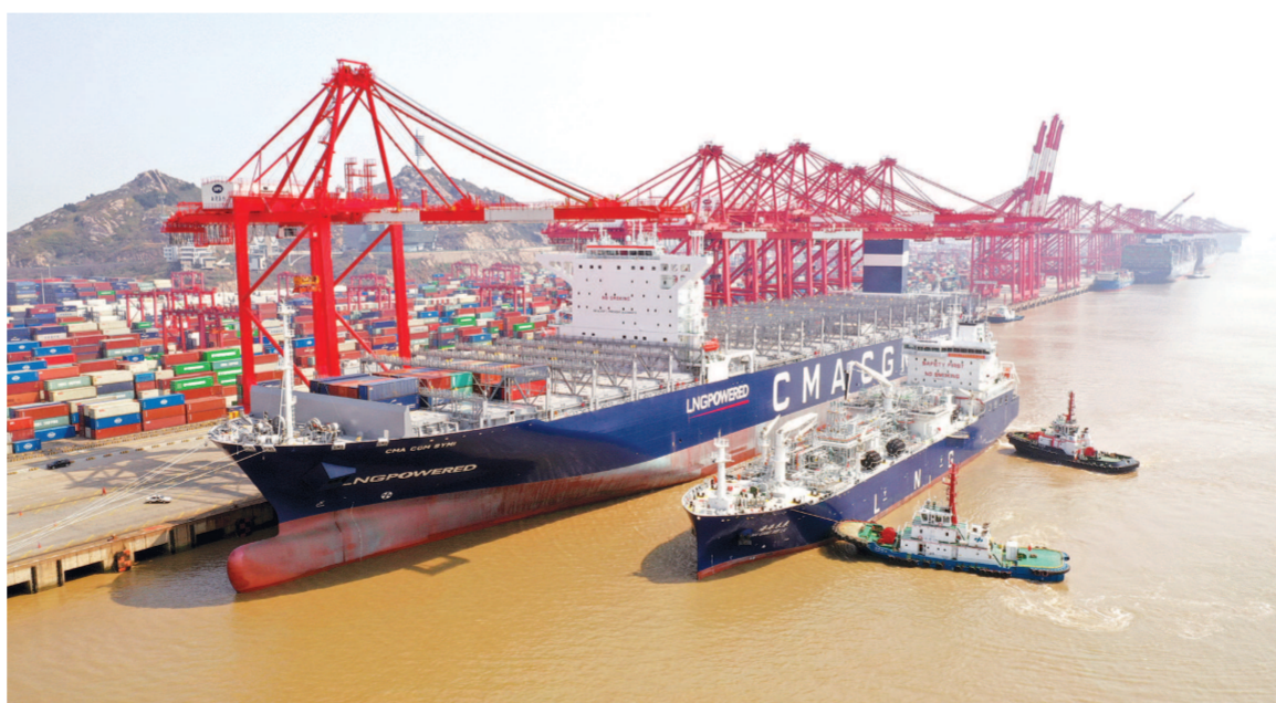
有“大胃王”之称的“海港未来”号LNG运输加注船为有“绿巨人”之称的“达飞希米”号集装箱轮加注LNG新型燃料。