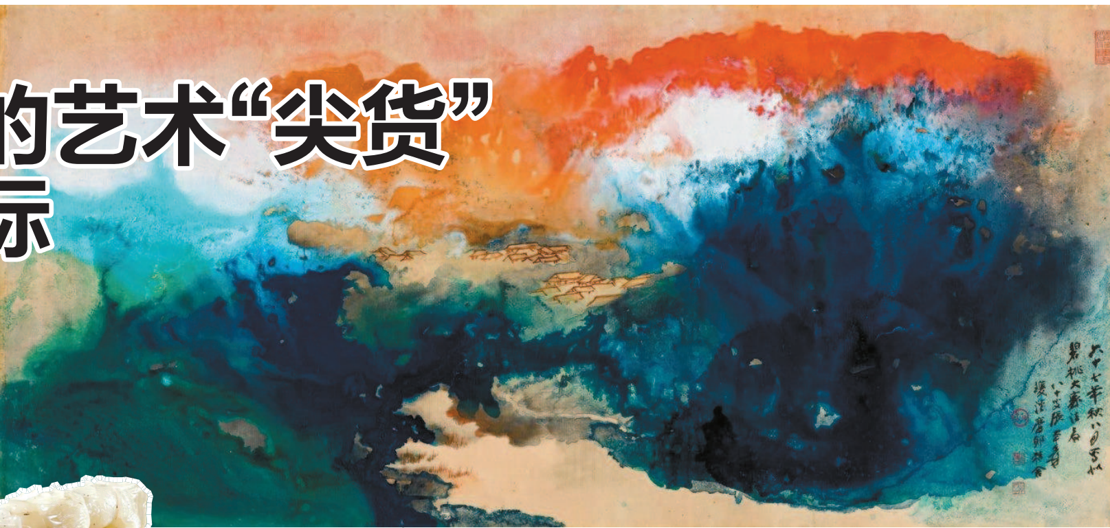
▲拍出1.955亿元的张大千《秋曦图》,成为本年度最贵中国近现代书画