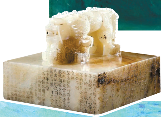
▲以近1.5亿港元成交的乾隆帝御宝交龙钮白玉玺,问鼎本年度最贵玉器