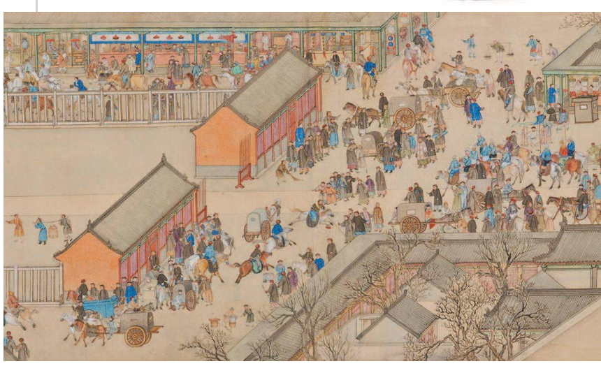
▲长逾18米的徐扬《平定西域献俘礼图》以4.14亿元成交价领跑本年度中国艺术拍卖,图为该作品局部