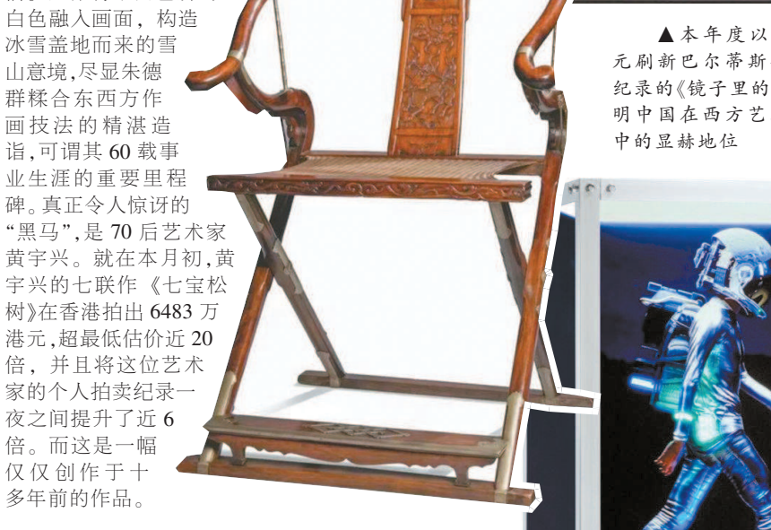
▲一把明末清初的黄花梨麒麟纹圈背交椅今年拍出6597.5万港元,成为世界最贵交椅