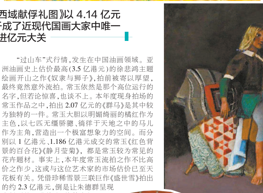
▲本年度以1.6675亿元刷新巴尔蒂斯全球拍卖纪录的《镜子里的猫III》,证明中国在西方艺术品交易中的显赫地位