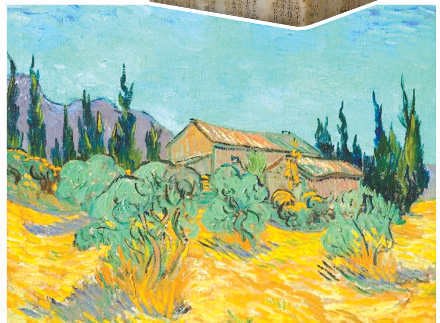
▲今年万亿美元的梵高风景油画《橄榄树和柏树间的木屋》,创出梵高作品史上第二高价

中华传统文化的持续升温,由本年度中国古代传统器物、书画“尖货”于拍场绽放的一连串惊喜给出印证。搭上几个近年来火爆的“概念”,这类拍品俨然成了金手指。 其中,“乾隆”概念风头最劲。几件天价拍品均与这位传奇帝王有关。拍出4.14亿元的徐扬《平定西域献俘礼图》,是本年度最贵中国书画。历时四五年完成的这件作品,以图像的形式还原了乾隆盛世最辉煌的时刻——平定准噶尔部及回部之后的国家庆典。它长达18.65米,绘制了超过八千个人物,刻画入微,色彩鲜艳饱满,兼具艺术价值和史料价值,从画面可以看出,当时有超过50个国家和地区参与了此次典礼。以2.6565亿元问鼎中国陶瓷世界拍卖纪录的,是清乾隆御制洋彩胭脂红地轧道雕瓷镂空“有凤来仪”百鸟朝凤图纹大转心瓶。高63厘米的这只瓷瓶,由颈瓶、腹瓶、底瓶、内胆瓶等上下内外四部分组成,汇洋黄、果绿、矾红、金彩、松石绿釉、胭脂红料彩、蓝料彩于一身,集轧道、雕瓷、镂空、转心等多种工艺。以2.415亿元成交的清乾隆《欽定补刻端石兰亭图帖缙丝全卷》,大幅刷新缙丝作品的全球拍卖纪录。缙丝历来为皇家御用织物,以生蚕丝作经线,彩色熟丝作纬线,以“通经断纬”技法织成,呈现雕琢镂刻及立体效果。此幅作品原藏于紫禁城建福宫延春阁,在超过17米的长卷上以缙丝工艺呈现书、画、印、碑帖,是至今所知唯一一件以碑帖为底本织作的缙丝作品,也是迄今所见最长的缙丝手卷,被誉为“缙丝之王”。乾隆帝御宝交龙钮白玉玺,拍卖市场上唯一的乾隆“纪恩堂”玺,凭借近1.5亿港元的成绩跻身本年度最贵玉器。 年末以1.4835亿元点燃艺术市场兴奋点的周之冕《百花图》卷,长逾17米,绘制四时折枝花卉近80种,无论尺幅规模与花卉品类,皆为吴门花鸟画重要画家周之冕公私所见其花卉之“最”,亦是对其“钩花点叶”技法的成功实践。这虽是一幅明代绘画,其市场关注度其实也离不开乾隆作为幕后推手。此幅作品因被著录于乾隆下令编撰的《石渠宝笈·初编》而名声大振,幅内印有的“乾隆御览之宝”“乾隆鉴赏”“石渠宝笈”“三希堂精鉴玺”等亦可佐证乾隆对其钟爱。 “明式家具”独特审美引发的认同,同样无愧于它在拍场上的“硬通货”地位——先有一把明末清初的黄花梨麒麟纹圈背交椅在香港拍出6597.5万港元,成为世界最贵交椅;后有一件明末清初黄花梨独板架几式巨型供案在北京以1.15亿元成交,刷新中国古典家具拍卖世界纪录。 往年领跑艺术“大盘”、勇攀价格高峰的近现代国画大家,今年的市场表现倒有些波澜不惊。齐白石、傅抱石、李可染、徐悲鸿、黄宾虹、潘天寿等一众大家均无作品挺进亿元大关。张大千成了唯一可以信任的名字。张大千晚年极稀见之作《秋曦图》本月在北京以1.955亿元成交,成为本年度最贵中国近现代书画,同时也是内地拍场张大千作品价格之最。此幅画面近十五平尺,笔致纵横跌宕,石青、石绿、白粉、朱橙参合交融,形成犹如自然大观中雪域湖海壮阔之姿的奇绝风貌。在香港拍场如鱼得水的,同样是这个名字。张大千的《碧峰古寺》与《春云晓霭》分别于佳士得香港春拍、苏富比香港秋拍拍出2.09亿港元、2.146亿港元。这两幅作品均为张大千巴西时期颇具代表性的泼彩作品。《碧峰古寺》为竖构图的巨碑式泼彩山水,以鲜艳的石青、石绿泼洒于华丽的金线之上。《春云晓霭》为横幅构图,画的是晨曦时分山水之间的烟云变幻,30年升值逾百倍。