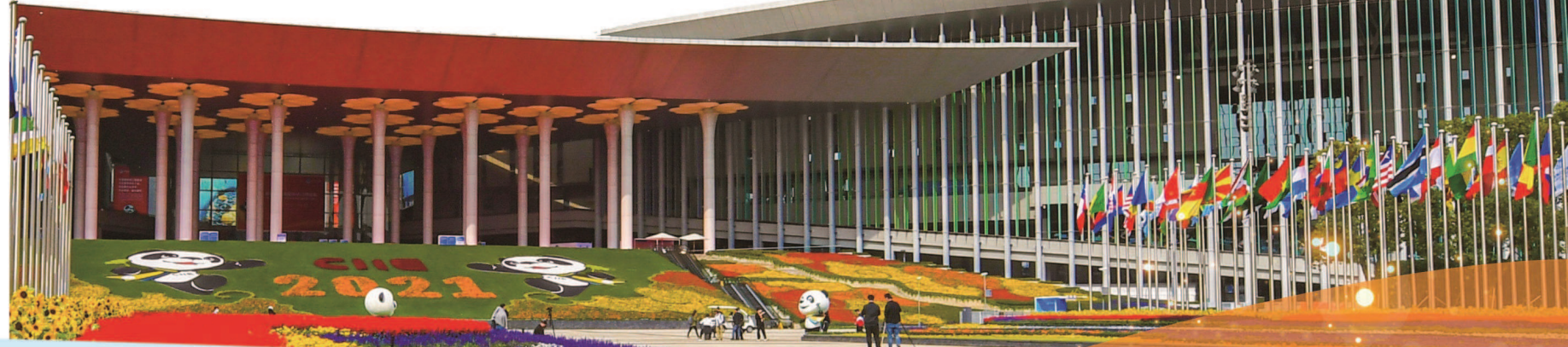
国家会展中心(上海)。本报记者 张伊展摄