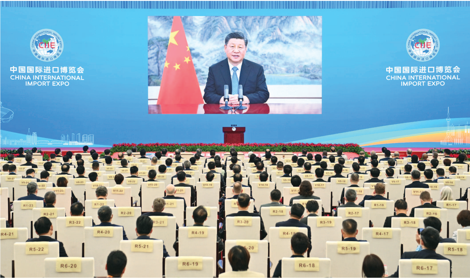
11月4日晚，国家主席习近平以视频方式出席第四届中国国际进口博览会开幕式并发表题为《让开放的春风温暖世界》的主旨演讲。