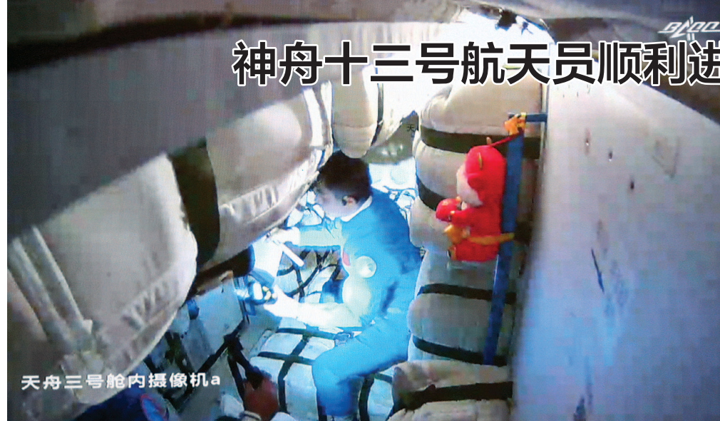
神舟十三号航天员顺利进入天和核心舱

在叶光富的成长轨迹中，母亲对他的影响最大。在他的记忆里，母亲独自扛起了家庭重任，却从不抱怨。为了供他读书，母亲尽可能多干一份活，多赚一份收入。有一阵，母亲包揽了村里种植桑树苗的活，施肥、浇水、锄草、打药，全靠她一人忙活。每当叶光富遇到困难时，母亲那副瘦弱而坚定的背影总能给他坚持的勇气。