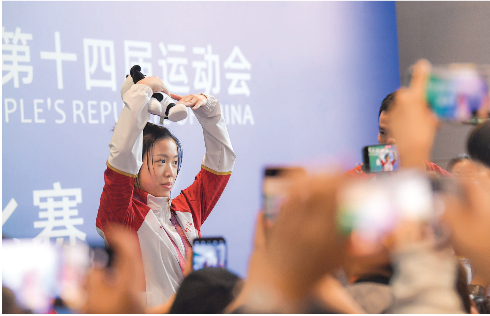
面对全运会混采区的“围堵”，在东京一战成名的射击奥运冠军杨倩向镜头比心。