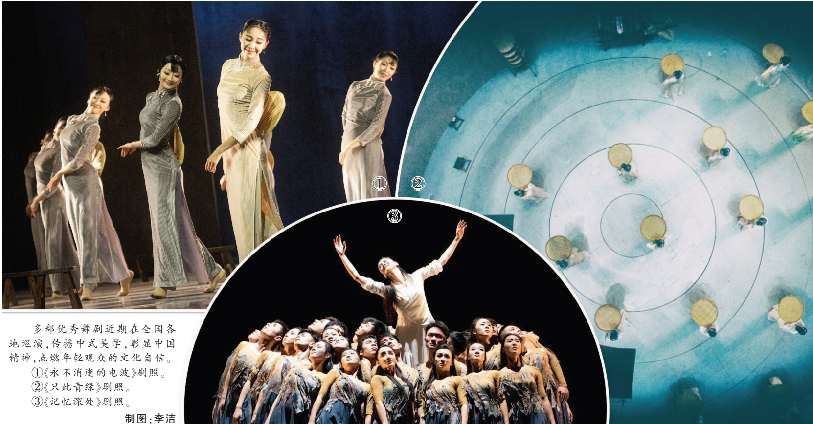
多部优秀舞剧近期在全国各地巡演，传播中式美学，彰显中国精神，点燃年轻观众的文化自信。 ①《永不消逝的电波》剧照。 ②《只此青绿》剧照。 ③《记忆深处》剧照。