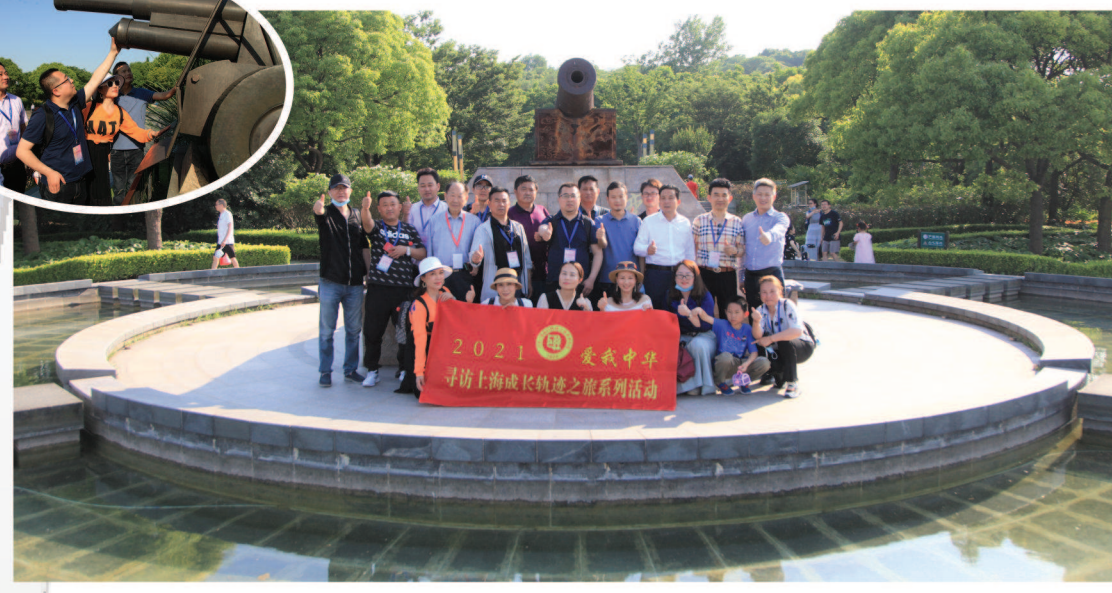
●吴淞炮台位于上海市宝山区,为黄浦江、长江、东海三水汇聚地,炮台是扼守长江、黄浦江的重要军事基地,清政府曾在此建造水师炮台,故得名“炮台湾”。清代名将陈化成率军抗击英军殉职于此,清朝末期中国第一条铁路“淞沪铁路”从此地始发开往河北老北站,抗战初期,十九路军曾经在此顽强抵抗日军。