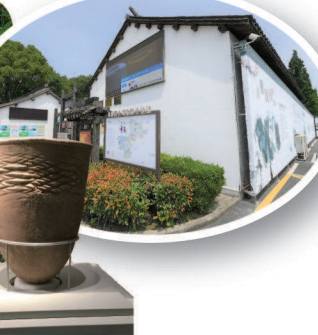
●金山区亭林镇地处冈身(古海岸线)西部,4000多年前,祖先在此繁衍生息。顾野王(519年-581年)曾生活在这里,遗有读书堆。他一生著作丰富,涉及文学、文字学、方志、史学等多方面,《玉篇》是中国第一部楷书字典,编纂的《舆地志》是全国性总志,被尊为“江东孔子”。