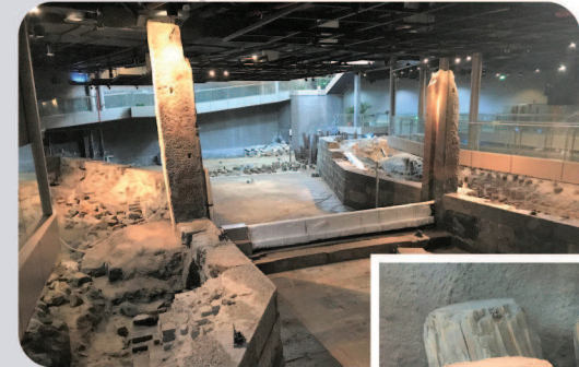
●志丹苑水闸建于1324年,是国内考古发掘规模最大、工艺精湛、保存完整的元代水利遗址,反映出来当时的上海与江南地区的经济、文化的发展。

上海是个文化的海。古代上海的历史文化,随着沧海变桑田,渐渐淹没,需要唤醒。 我长期从事文化工作,对上海的崧泽文化、福泉山文化、马桥文化、广富林文化和青龙镇等古镇文化情有独钟。然而,不少朋友总是对我说,上海是由一个小渔村发展起来的,老城厢不过700多年的历史,上海也不过是1300多年的城镇史。他们的看法总是让我十分惊讶,这说明我们对上海历史文化的传播不够。 从上世纪九十年代起,青浦崧泽古文化遗址、福泉山遗址和青龙古镇的几次考古发掘,我都参与其中,与上海历史结下了不解之缘。我亲眼目睹了上海历史文化碎片的打捞,心中对古代上海充满了自豪感和自信心。 远古的上海,青浦最早成陆,它濒临大海,湖泊众多,湿地广袤。随着时间的推移,大海演化成陆地。从崧泽遗址的考古发现证明:早在六千年前,我们的上海先民凭借着坚定的信念、聪明的智慧、开拓的进取,征服了恶劣的自然环境,并以开放的胸怀,创新的精神,发明与创造了无数个上海“第一”,把古代上海改造成宜居宜业,天人合一的“风水宝地”。而崧泽古文化遗址的考古发现,填补了上海无“古”可考的空白,颠覆了上海是由小渔村演变而来的结论。 而青浦的福泉山古文化遗址,也是上海的全国文物保护单位。在福泉山的五色土层中,蕴藏着许多上海地区的文化密码,记载了上海先民创造、创意和创新的历史。它出土了大量的玉器,那“高大上”的墓葬、丰富多彩的文物、高超精美的制造工艺、繁复精致的结构,都印证了福泉山是古上海最早的文明发祥地,城市的中心。福泉山作为良渚文化类型,2019年被列入世界文化遗产名录。 唐宋时期的青龙镇,是上海最早的对外贸易港口。青龙镇是上海酒业的发生地,蓝印花布的首创地,米业、布业、酒业、丝绸、茶叶、陶瓷都在这里集散和交易。它是我国古代“海上丝绸之路”的起点之一。还有上海星罗棋布的历史文化名镇,都给上海增添了诗意和魅力。 所有这些绵流长的历史文脉,它们都为上海的城市精神塑造,“海纳百川,追求卓越、开明睿智、大气谦和”,烙上了深深的先进文化的底色。上海文化的多元性、先进性、原创性,从上海六千年至今,传承和实践从来都没有停止过。 我以为上海不能割断文化的血脉,要对上海文化的源头,进行寻根溯源,讲述好上海的故事,传播好上海的历史,鼓舞新老上海人更加自觉、自信和自强地投身于把上海建设成具有世界影响力的社会主义现代化国际大都市。让上海古文化的源头活水,汇聚于当代上海人的智慧创新,充分涌动和奔流。使上海这座城市更有温度和情怀,更具厚重感和人文感。 (作者系中国作家协会会员、上海市文联委员、青浦区文联主席、研究员)