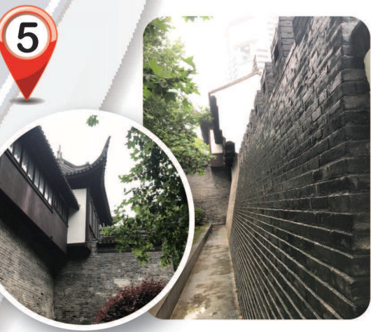
●上海县立后,没有建造城墙。明嘉靖三十二年(1553年)仅用3个月时间筑了一座周长9华里,高2.4丈的城墙,沿城墙外面筑有宽6丈、深1.7丈、周长1500余丈的城墙。清代后期,上海经济迅速发展,古城楼阻碍城内外交通,于1912年、1913年城墙拆除,泥土填没城墙。