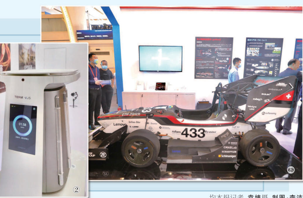
均本报记者 袁婧摄 制图:李洁

两年参加全球技术转移大会,去年他们携15项创新需求而来,今年继续加码,一口气发布了25项创新需求。