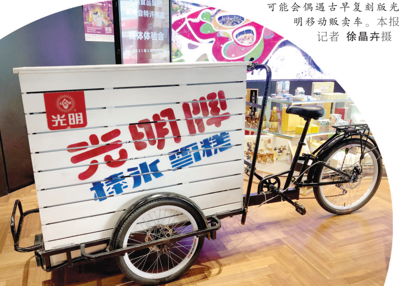
在花博会园区，游客可能会偶遇古早复刻版光明移动贩卖车。

另一标志性的建筑“大蝴蝶”的巨型翅膀也暗藏玄机。设计师告诉记者，2万平方米的蝴蝶翅膀其实是一座有着夸张“长厚比”的混凝土壳。“打个比方来说，屋顶跨度为280米，壳体厚度仅250毫米，相当于一个2米长的桌子，桌面板的厚度只有不到2毫米。”在设计过程中，设计师和结构师多次找形，反复计算以确保它的荷载，“设计师拉出造型，结构师算是否合理，然后修型，设计师觉得不够美观，再拉新的形状，再结构计算，这样反复交替多轮，最终才敲定下来。”而壳顶种植花卉也是为了与周围环境融为一体，让这么大的建筑“隐身”在生态环境之中。