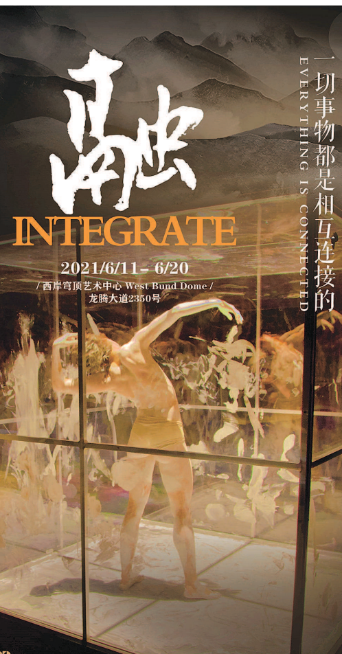
一切事物都是相互连接的 EVERYTHING IS CONNECTED INTEGRATE 2021/6/11-6/20 西岸穹顶艺术中心 West Bund Dome 龙腾大道2350号 龙腾大道2350号

据悉，不少凭借《舞蹈风暴》破圈的优秀舞者加入沈伟的新团队，广东现代舞团、谢欣舞蹈团也加盟了《融》的演出。其中，朱凤伟、郝若琦、郑杰、苏海陆和王念慈等青年舞者常年活跃在剧场舞台，与中国上海国际艺术节有着深厚渊源。沈伟告诉记者，他与团队将在上海展开为期一个多月的训练和排演。“沉浸式艺术现场的表现形式对舞者的艺术能力和专注程度都是极大挑战，要求舞者真正表达出动作的质感，而非‘照葫芦画瓢’。”