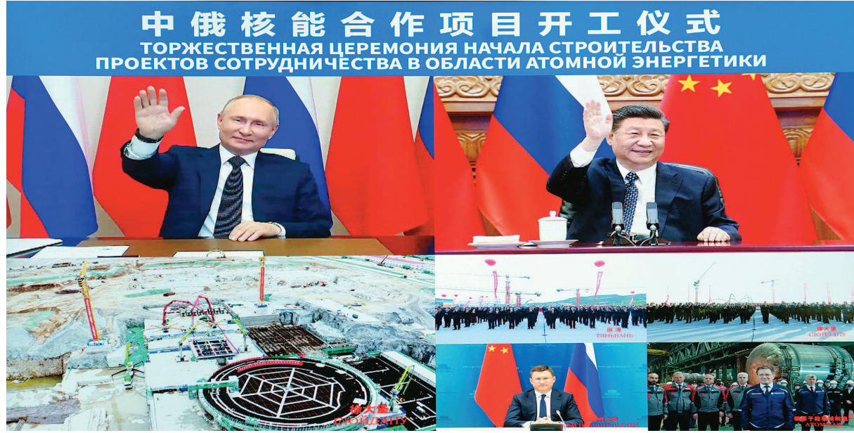
习近平同普京共同见证两国核能合作项目——田湾核电站和徐大堡核电站开工仪式。新华社记者 岳月伟摄

国内统一连续出版物号 CN31-0002 国内邮发代号 3-3 国外发行代号 D123 客户端:文汇