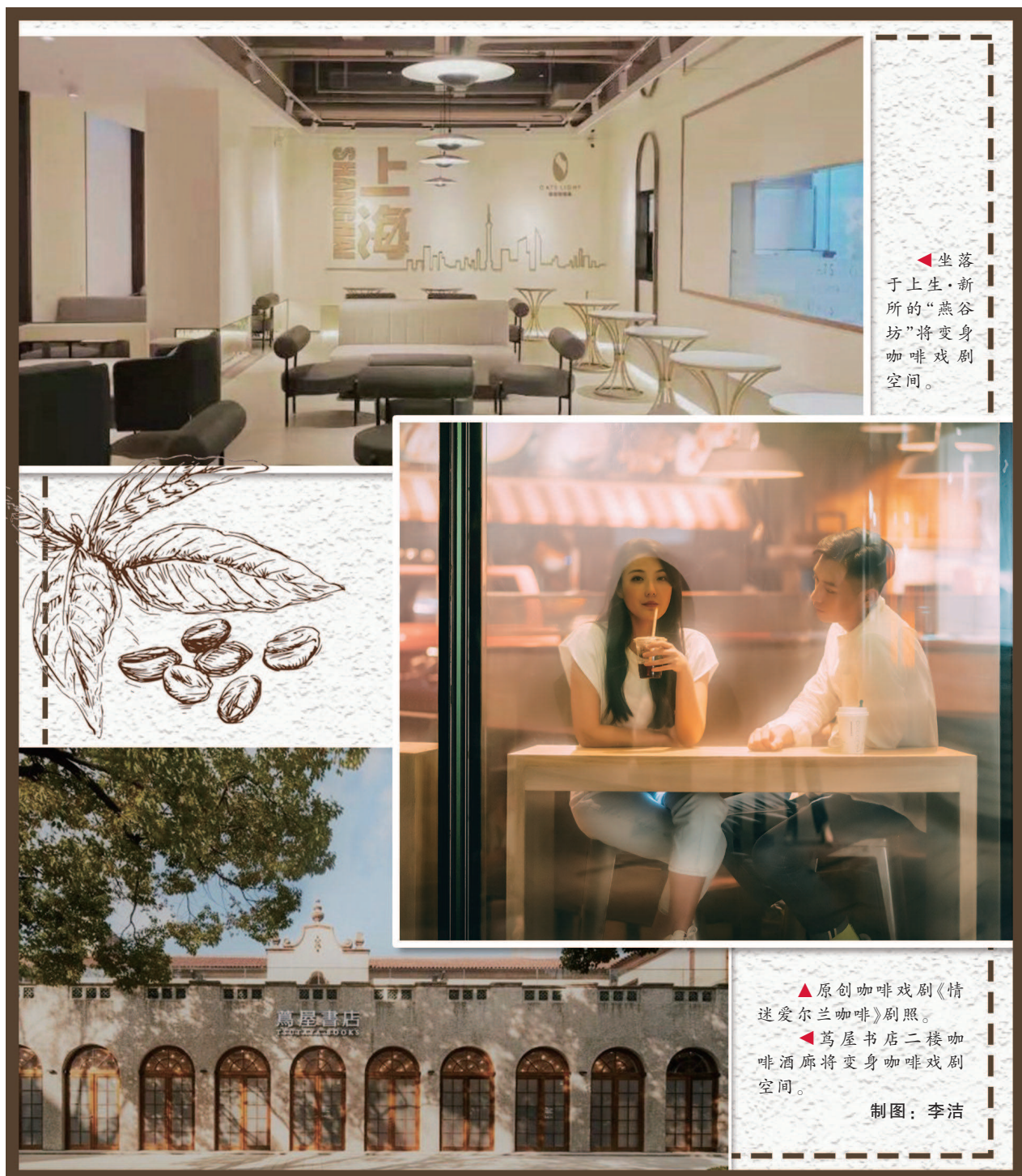
坐落于上生·新所的“燕谷坊”将变身咖啡戏剧空间。

拥有多处百年历史建筑遗迹、又记载着新中国工业发展史的建筑群——上生·新所，自2019年开业以来，逐渐迎来文创园区之外的更多业态入驻，艺术与文化的氛围愈发浓厚。首届咖啡戏剧