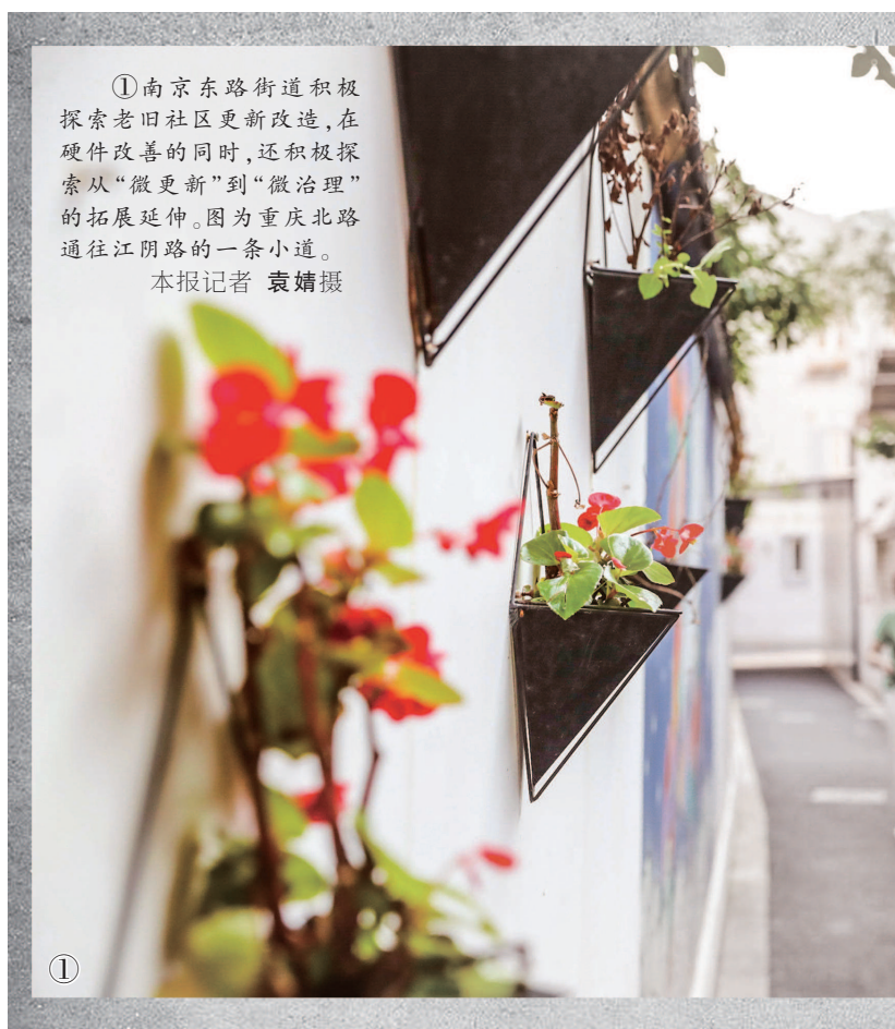
①南京东路街道积极探索老旧小区更新改造，在硬件改善的同时，还积极探索从“微更新”到“微治理”的拓展延伸。图为重庆北路通往江阴路的一条小道。本报记者 袁婧摄