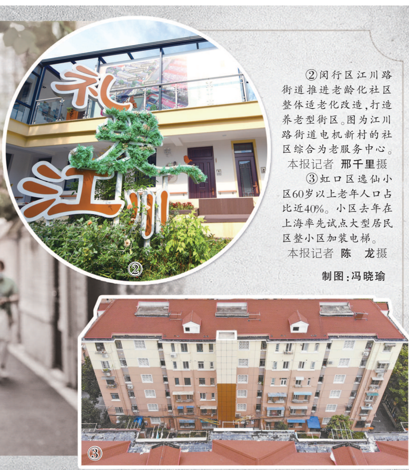
②闵行区江川路街道推进老龄化社区整体适老化改造，打造养老型街区。图为江川路街道电机新村社区综合为老服务中心。