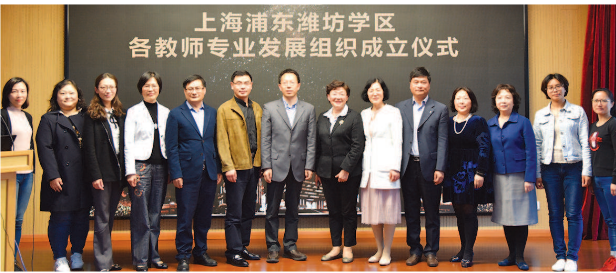
上海浦东潍坊学区各教师专业发展组织成立仪式

流动站”的“领衔人”，通过专题讲座、个别指导等方式，引进所在学科最新的研究成果、发展方向，并组织外出考察，开阔眼界。“教师专业发展组织”，为各校教师走向专业发展铺设了共同的道路。