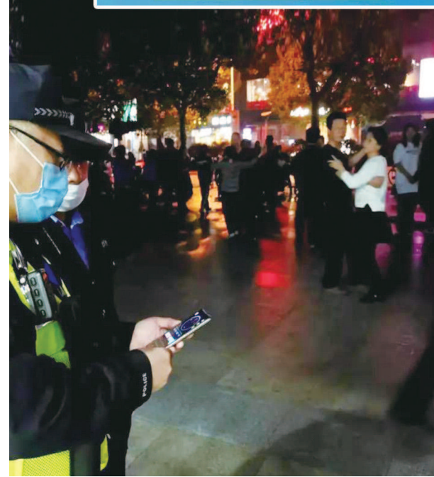
大华派出所充分利用线上平台与社区居民沟通交流，畅通群众反映问题的渠道。制图：李洁